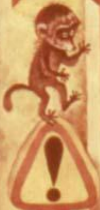
рисунок Герты Портнагиной