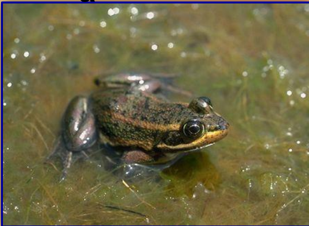
озерная п а