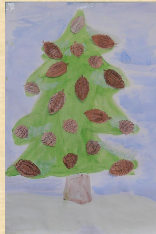
6 – в класс