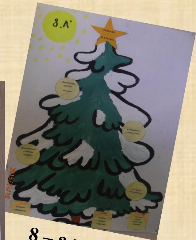
8 – а класс