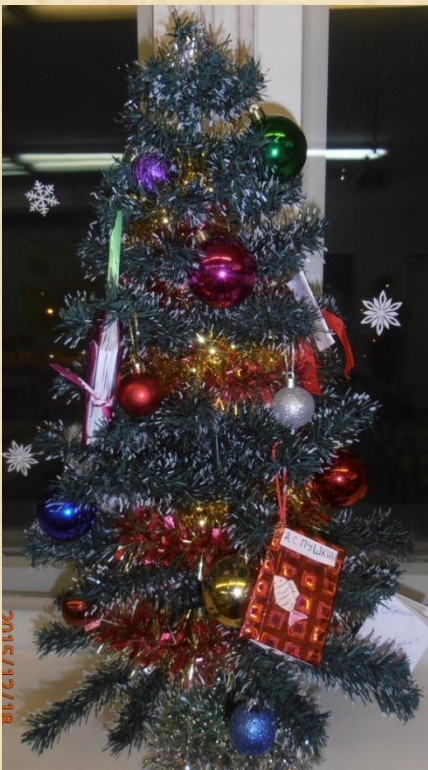
6 – б класс