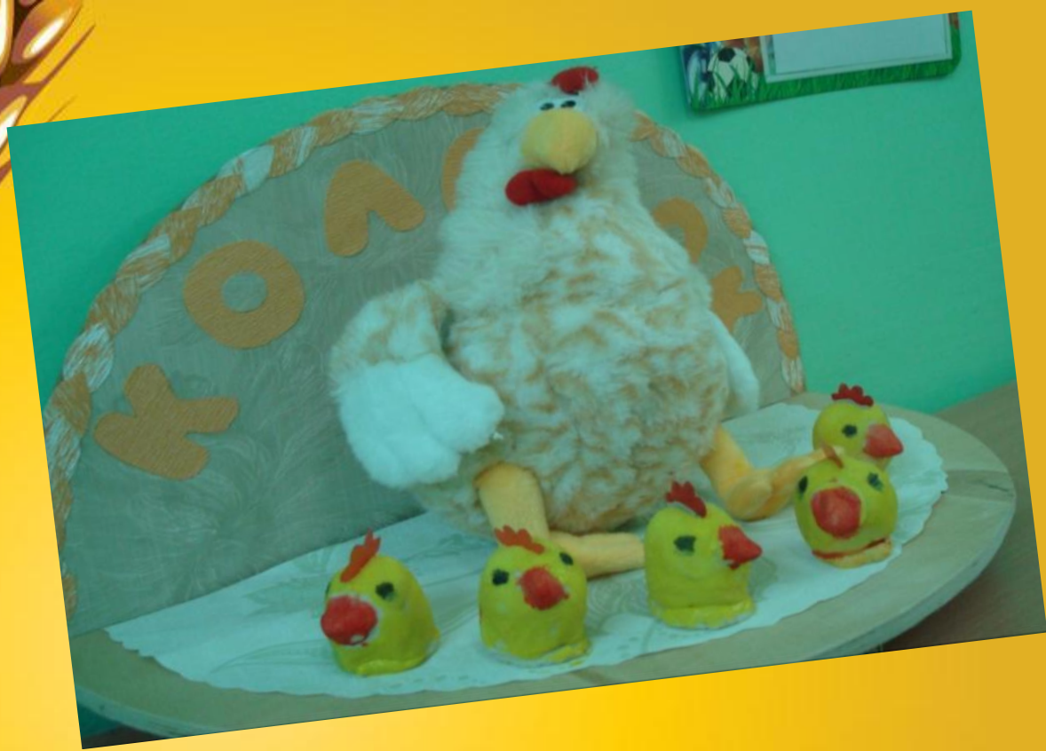
«Курочка и цыплята»