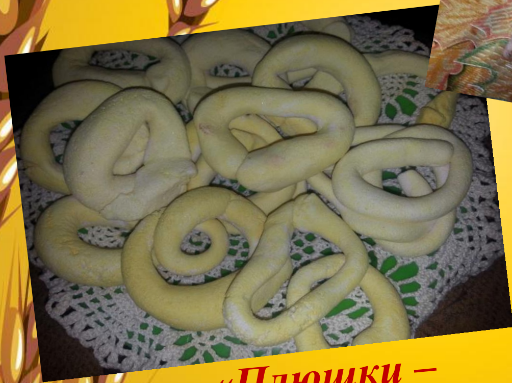
«Плюшки – завитушки»