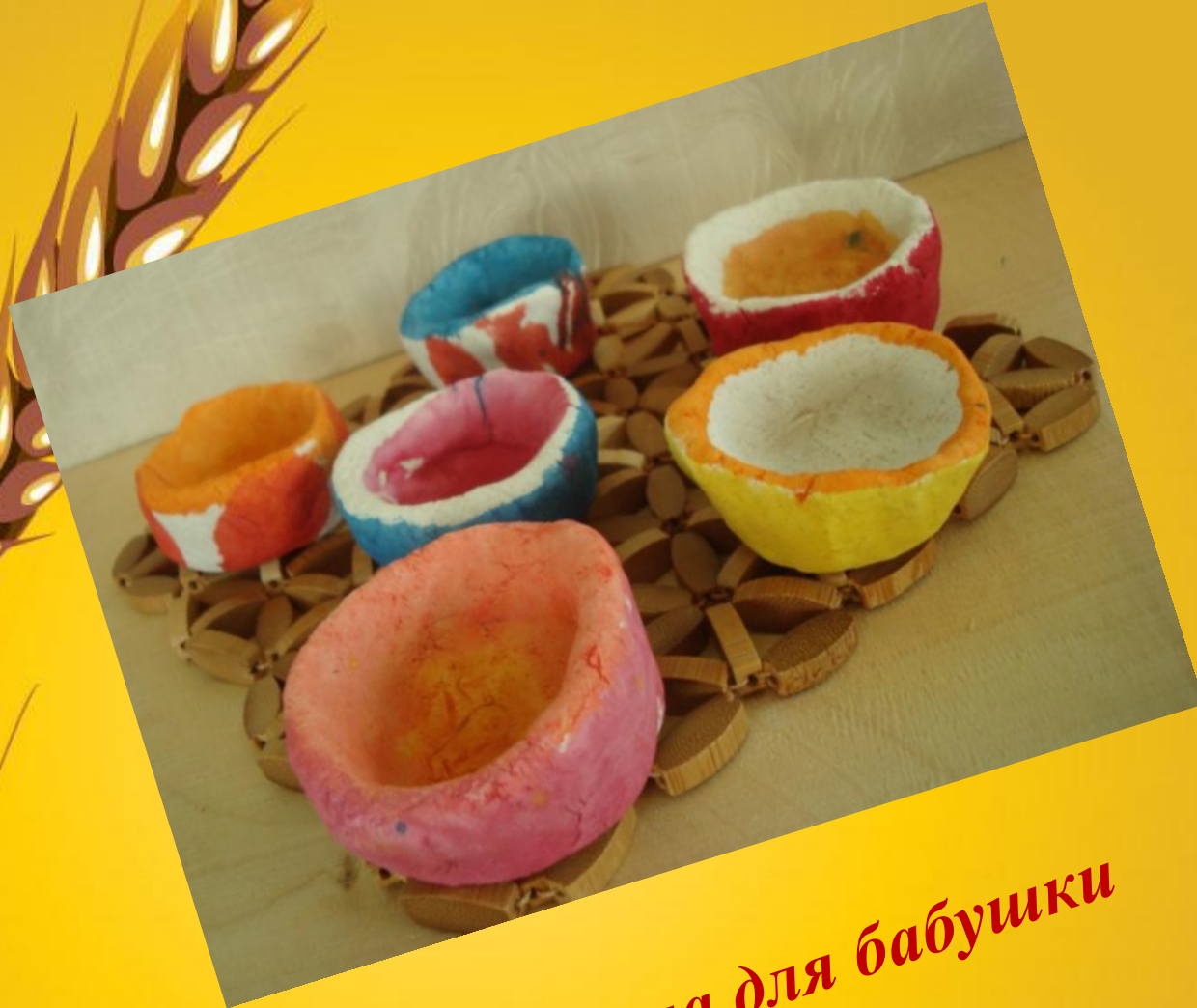
«Пиала для бабушки Алтыной»