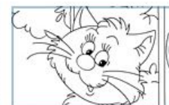
Раскраска "Кот Васька"