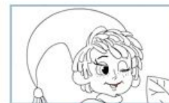
Раскраска "Маленький гном"