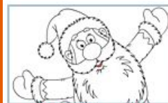
Раскраска "С новым годом!"