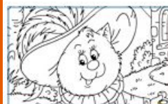
Раскраска "Кот в галгах"