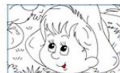
Раскраска "Красная Шапочка"