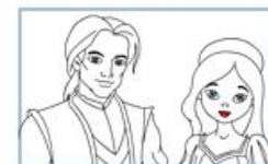
Раскраска "Красивая пара"