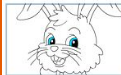
Раскраска "С Пасхой!"