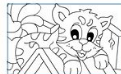
Раскраска "Весёлые друзья"