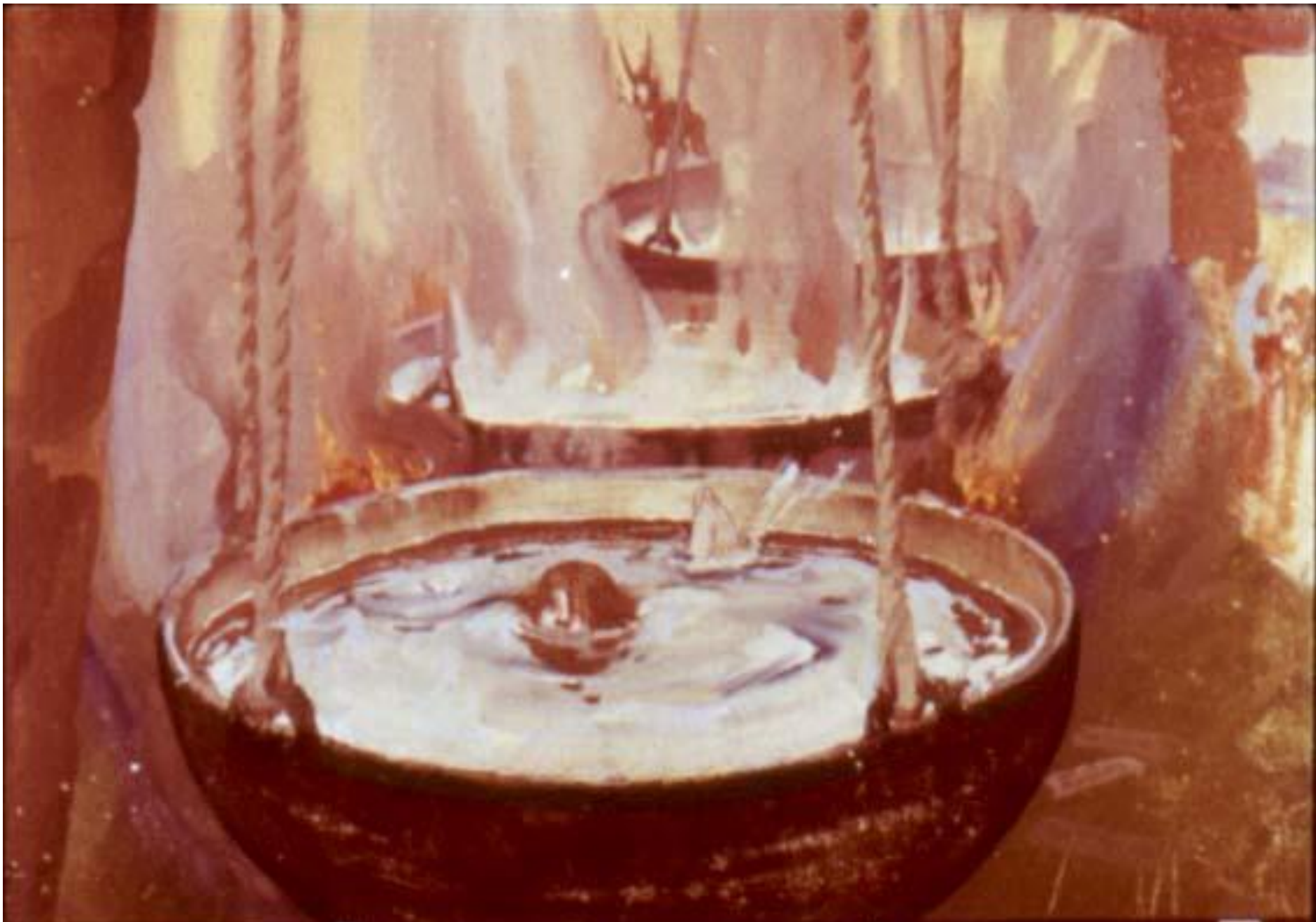
Тут в другой, там в третий тоже,