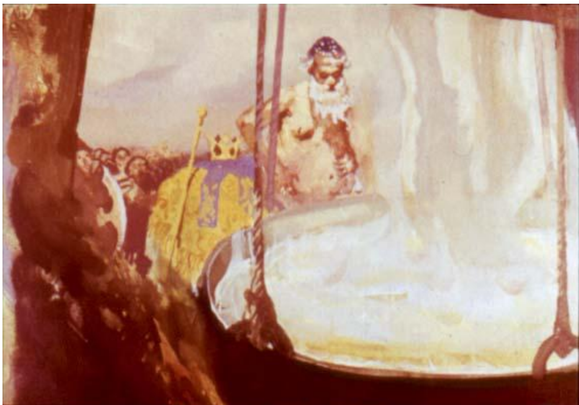
Царь велел себя раздеть,