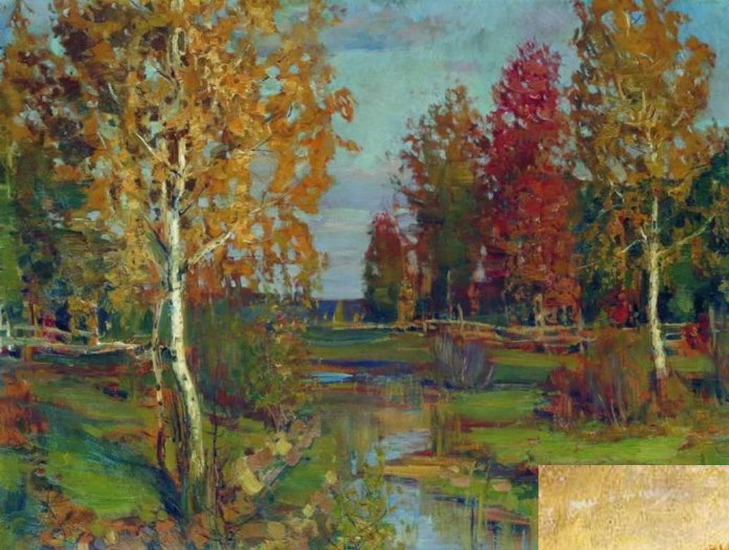
И. И. Левитан «Осень»