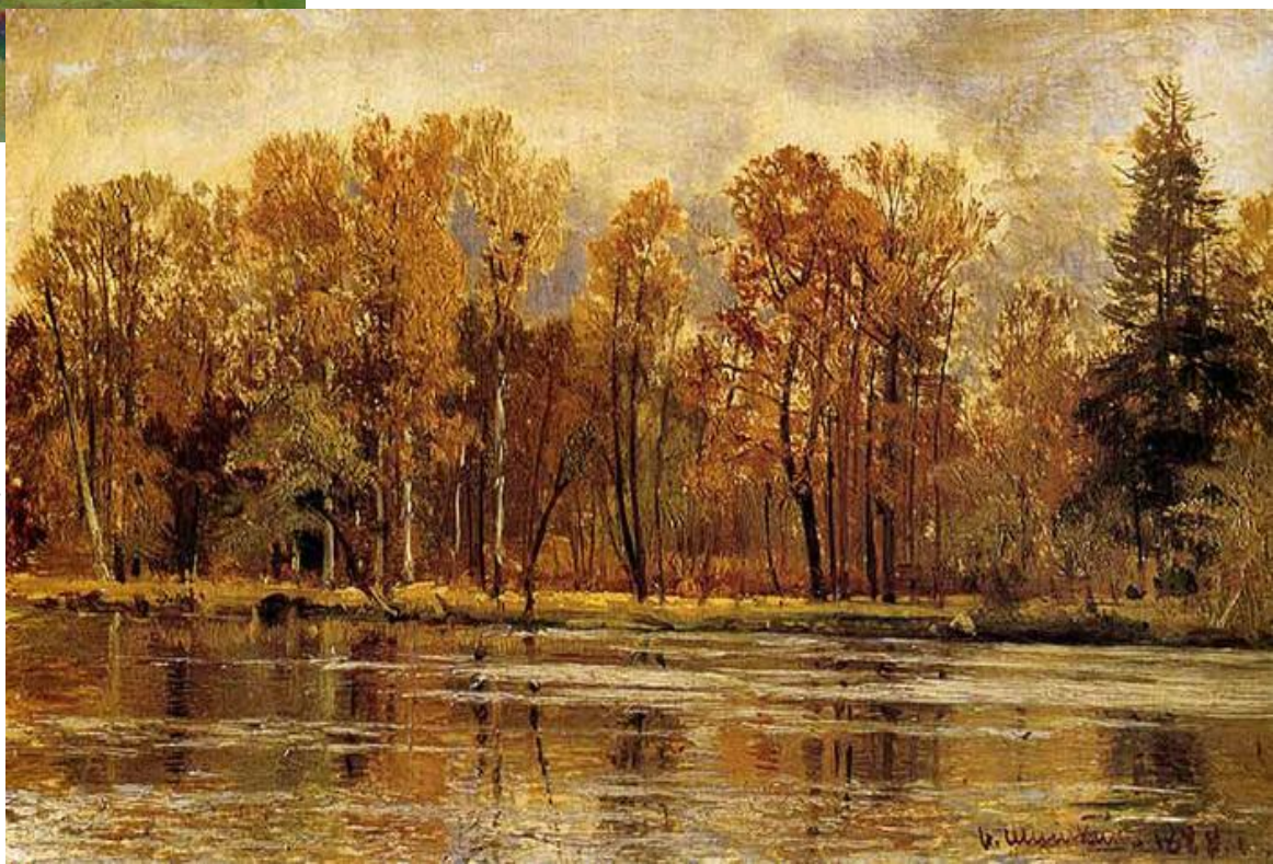
И.И. Шишкин «Золотая осень»