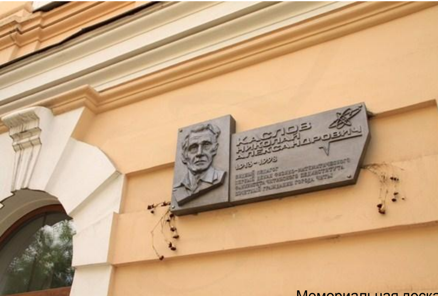
Мемориальная доска, посвященная Н.А. Каслову. Чита. Автор Н.М.Полянский