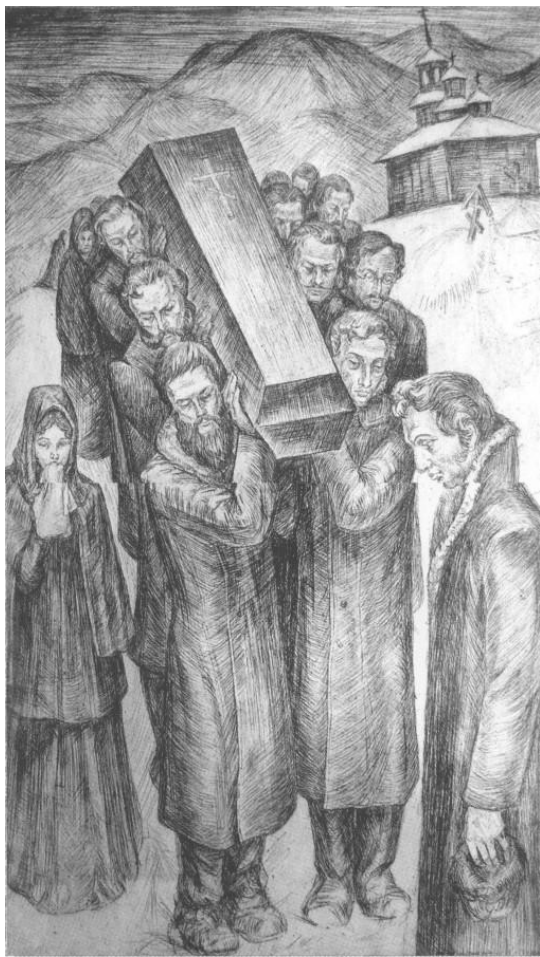
Последний путь Муравьевой" офорт Н.М. Полянского

Произведения хранятся в музеях Москвы , Читы, Иркутска, частных собраниях.