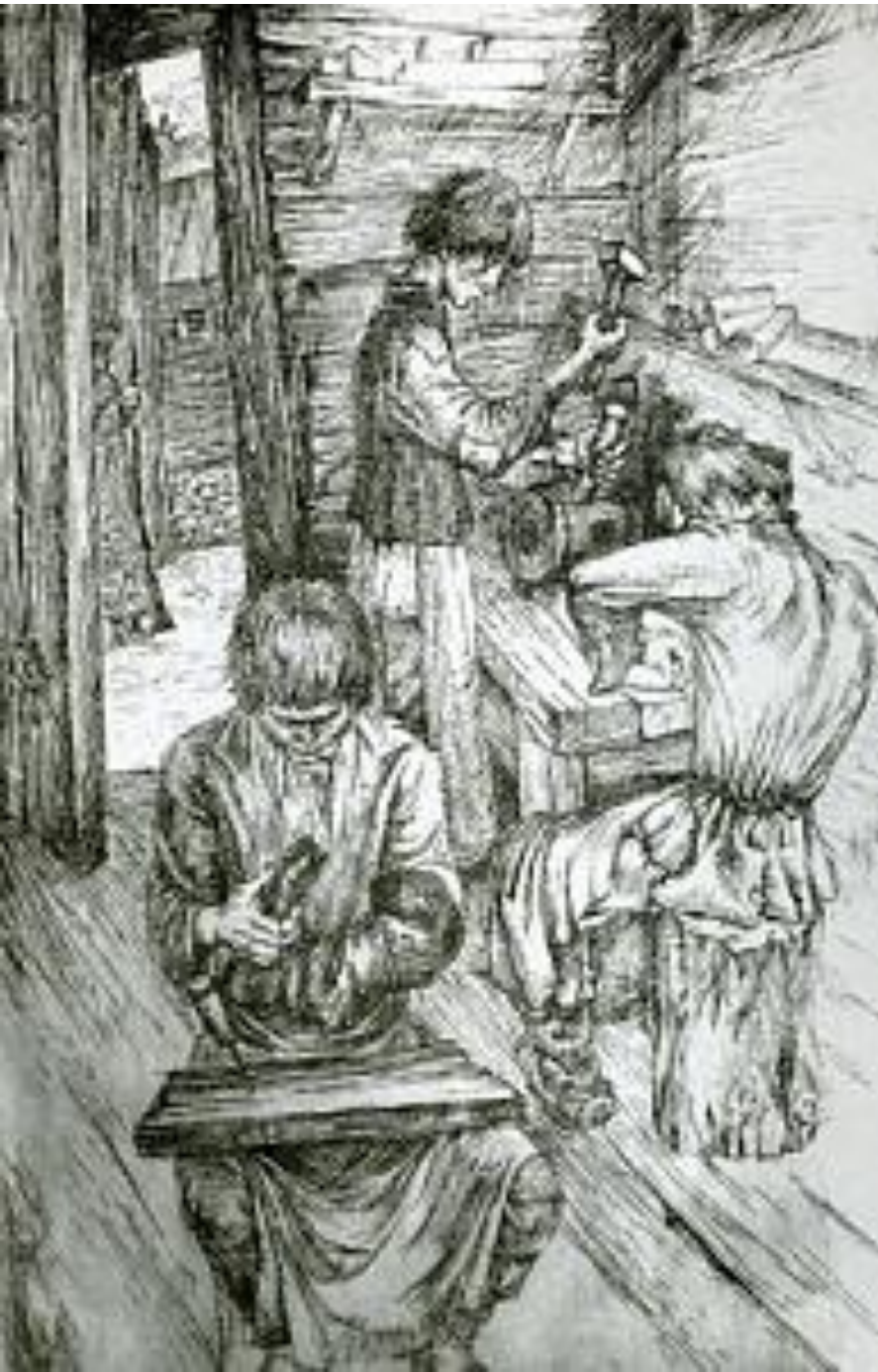
Обучение ремеслу. офорт Н.М. Полянского