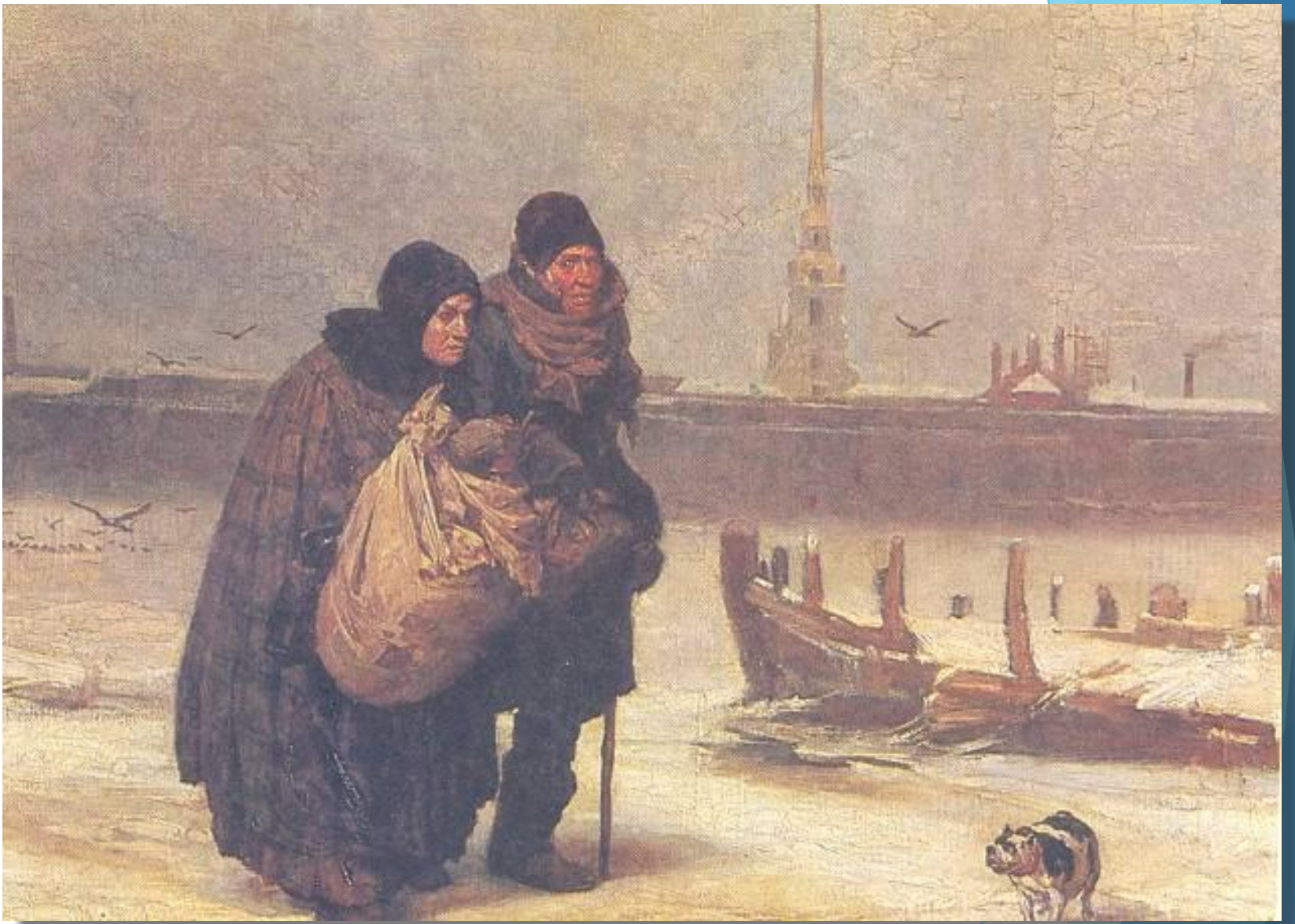
Виктор Васнецов. «С квартиры на квартиру»