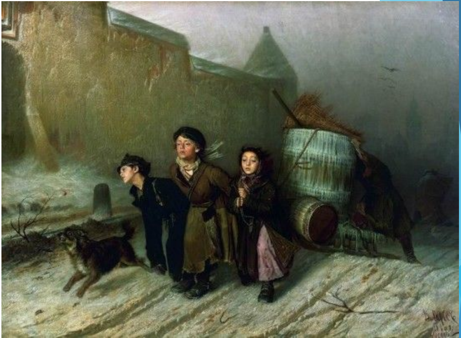
«Тройка». В. Перов