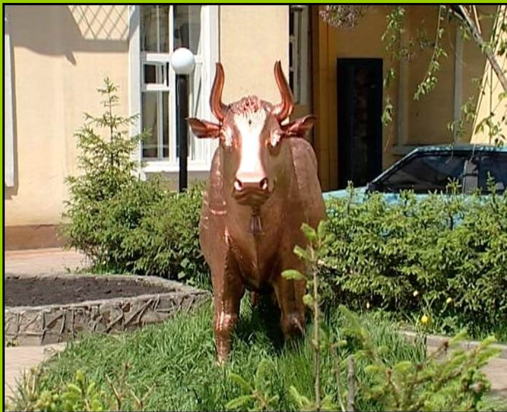
Памятник корове в городе Иркутске.

Молочные продукты играют огромную роль в питании человека. Люди давно уже не могут жить без коров. И не смогут существовать никогда. Не случайно коровам устанавливают даже памятники .