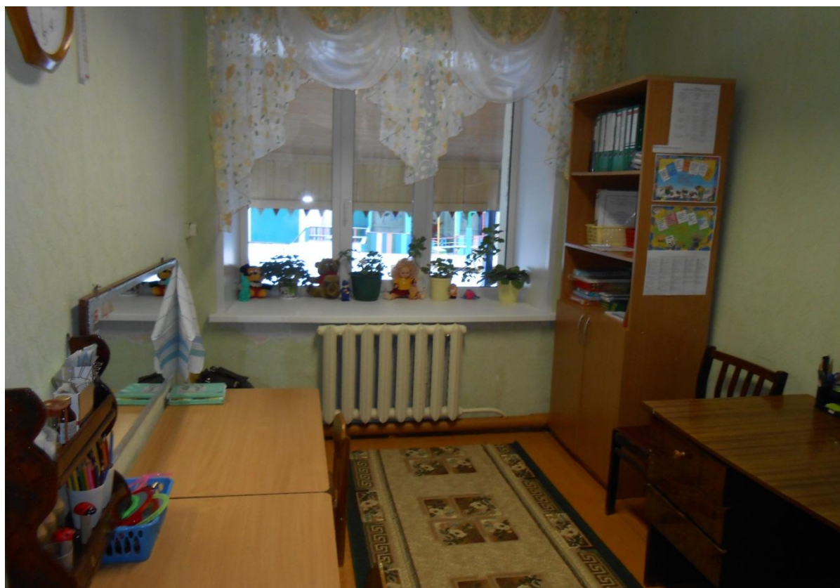
Общий вид кабинета