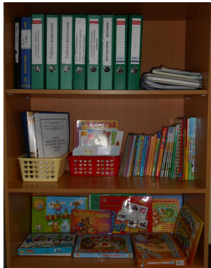
Зона методического сопровождения