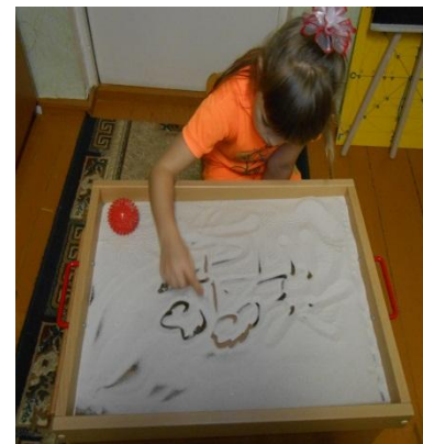
Зона психологической разгрузки