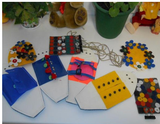
Зона развития мелкой моторики