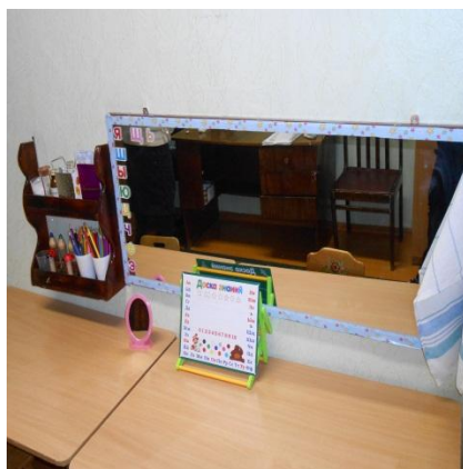
Зона коррекции произношения