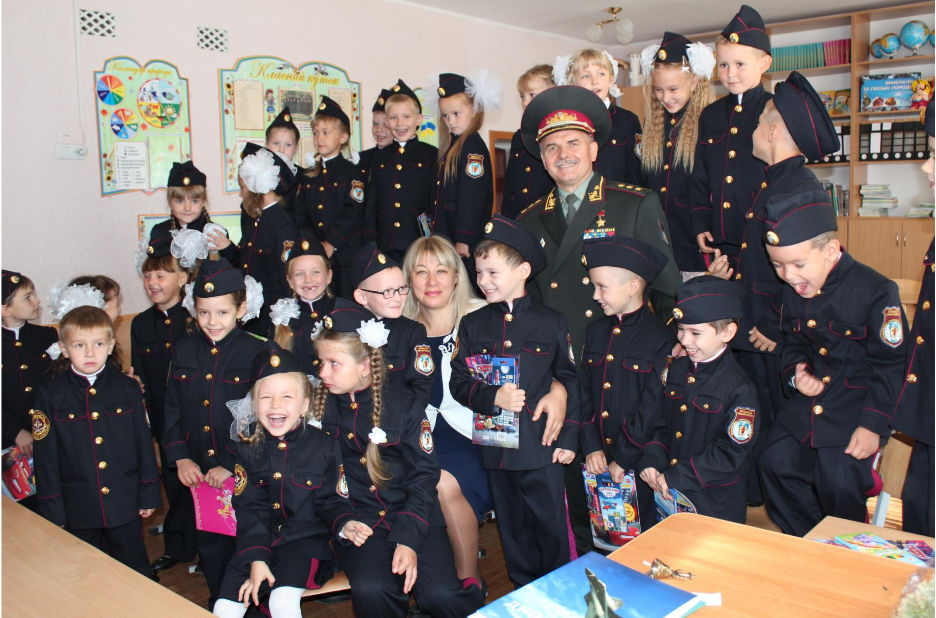
Доречний гумор, доречний жарт у родині козачат