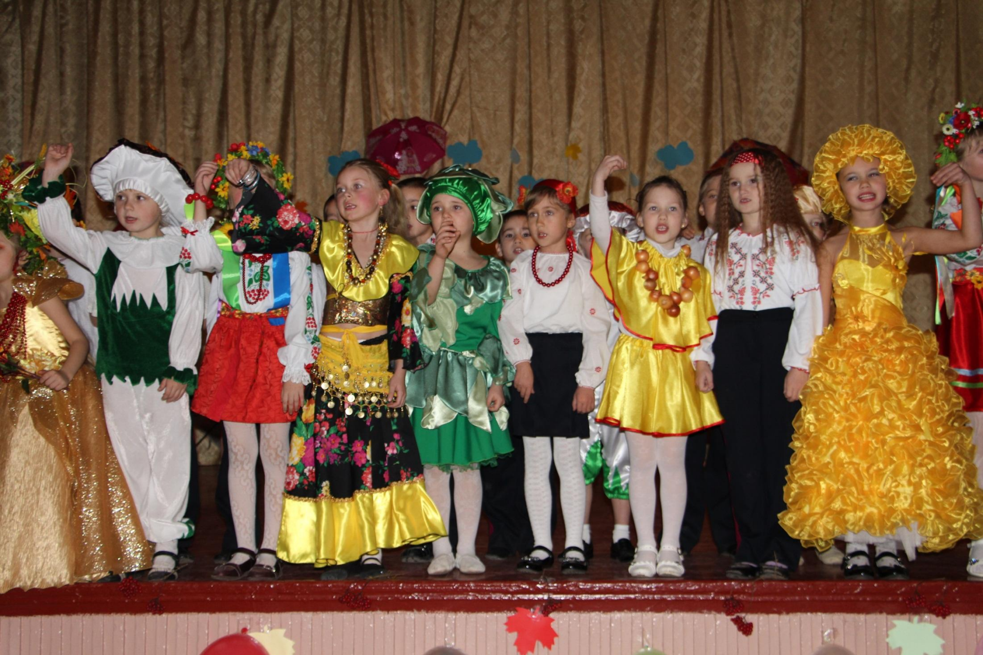
Осінній бал у козачат