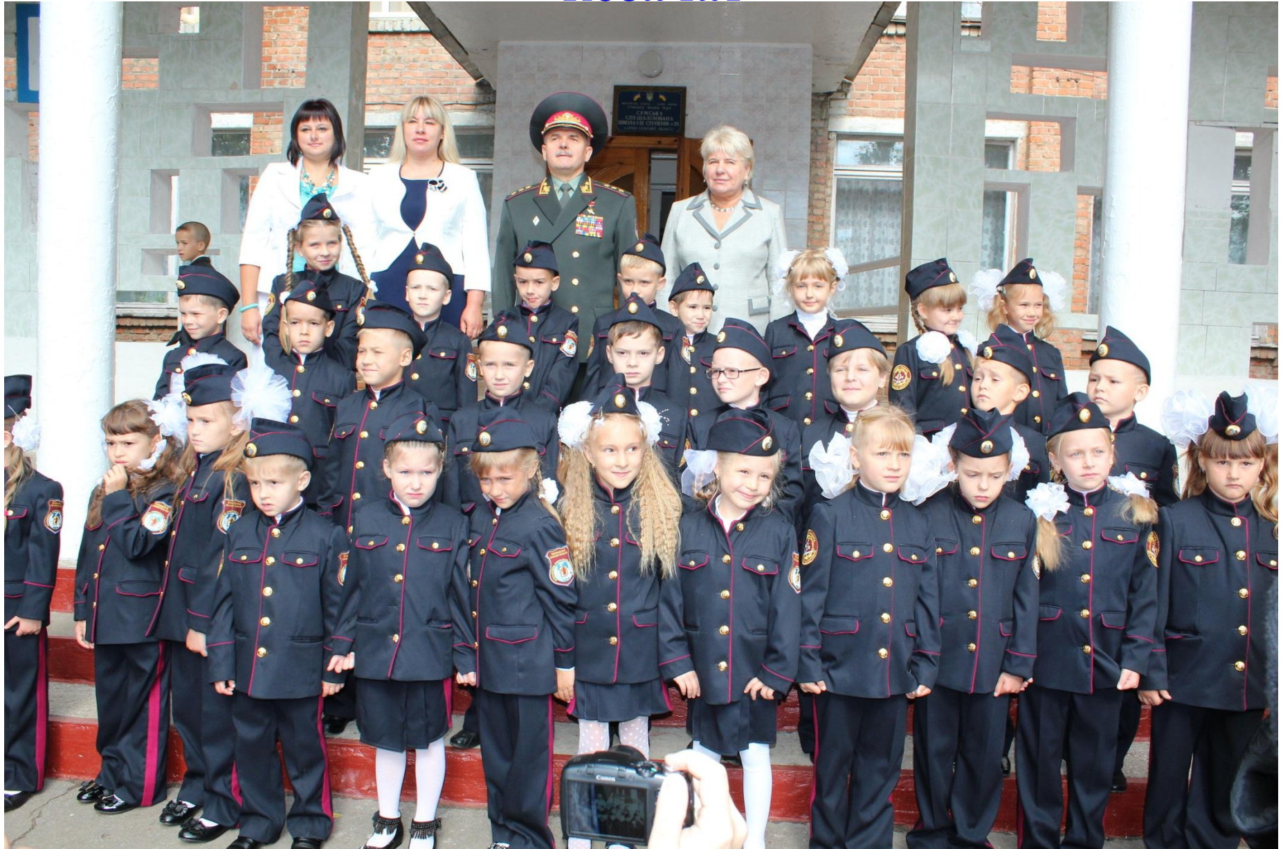
Фото на пам'ять – важливий момент в житті козачат