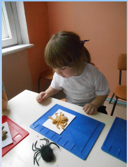
«Паучок». Лепка из соленого теста. Младшие и средние группы.