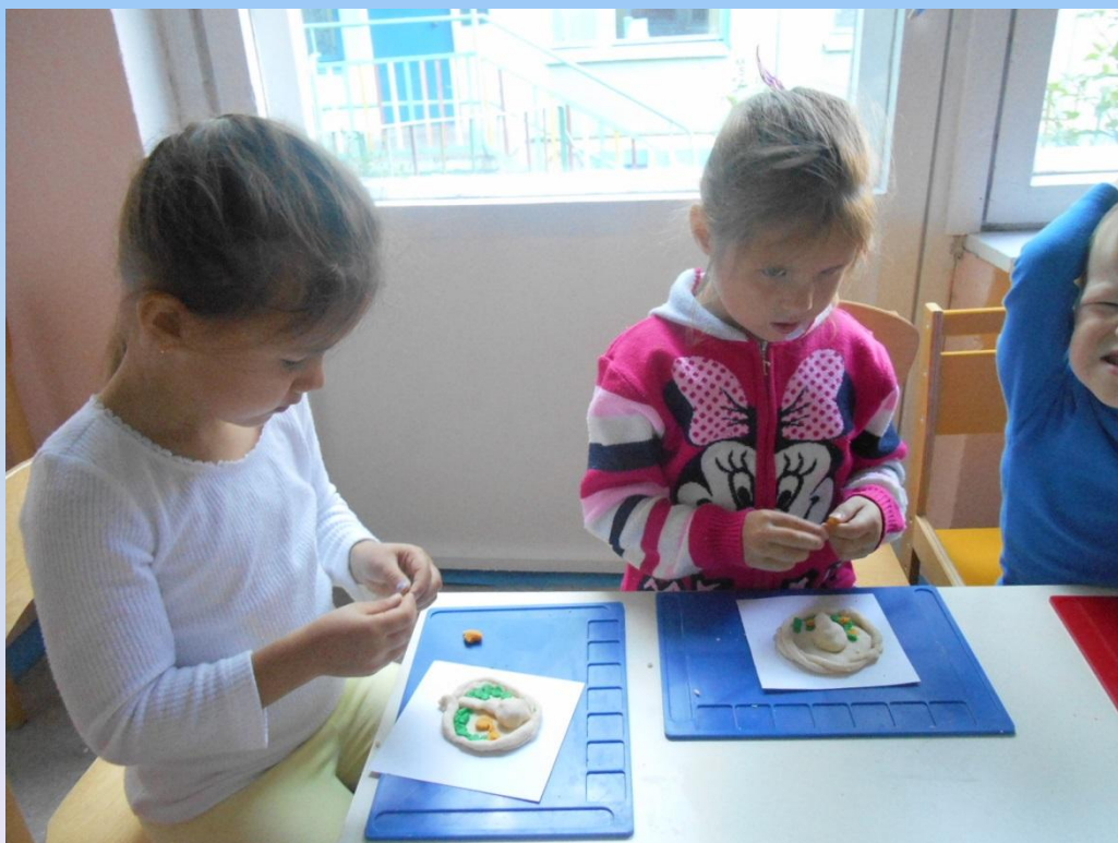
«Грибочки на поляночке». Лепка из соленого теста Старшие группы.