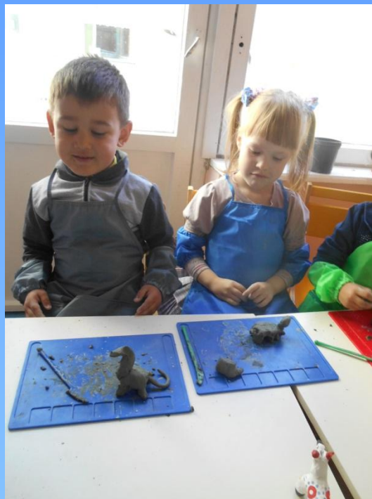
«Динозавры». Лепка из глины Средние группы.