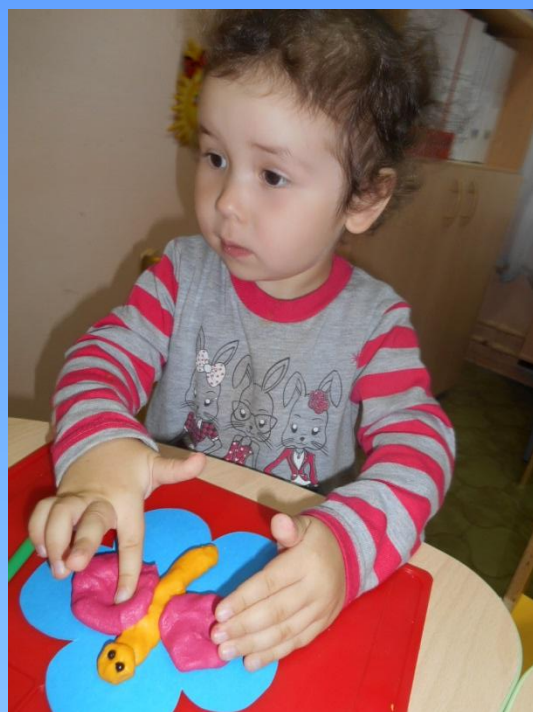
«Бабочка». Лепка из соленого теста Младшие и средние группы.