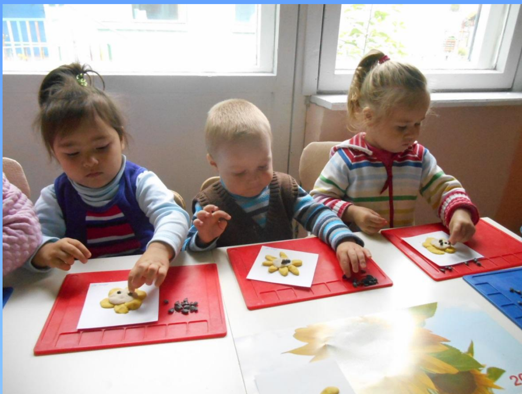
«Подсолнух». Лепка из соленого теста Младшие и средние группы.