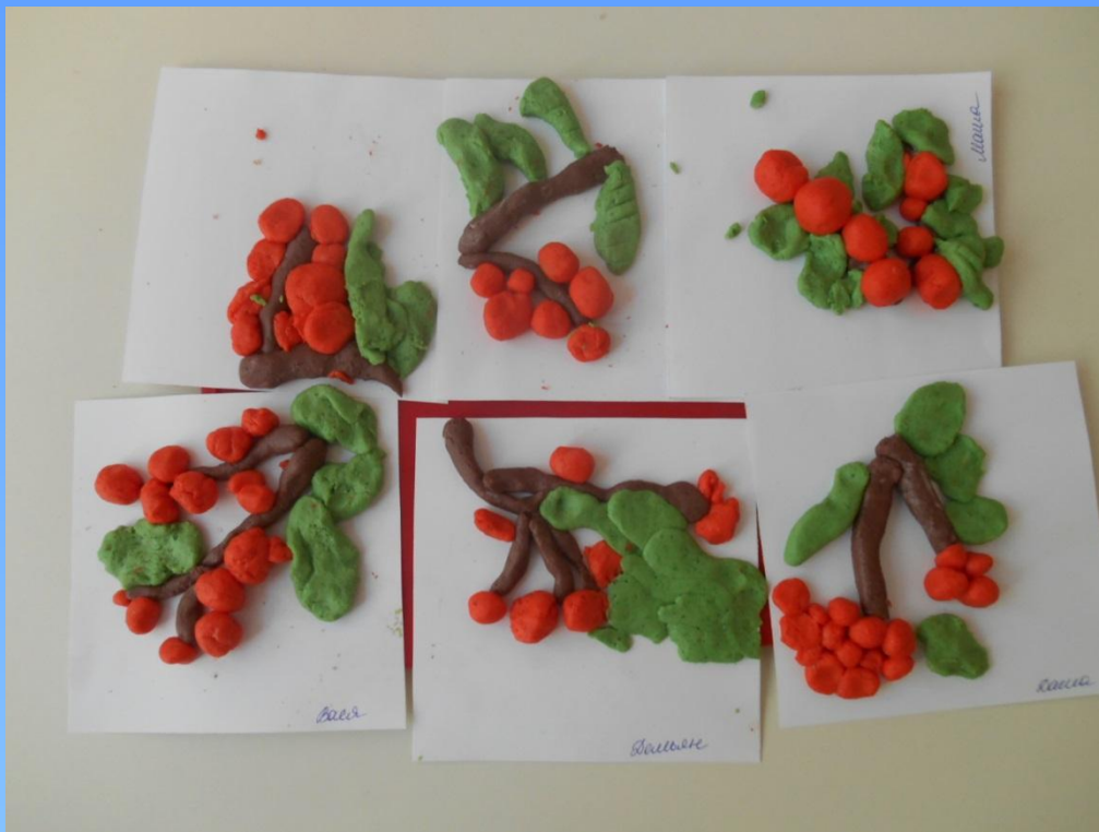
«Кисть рябины». Лепка из соленого теста Младшие и средние группы.