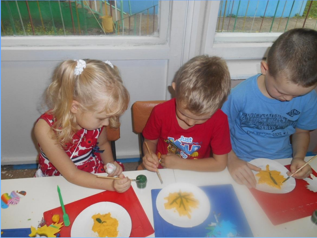
«Кленовые листья». Лепка из соленого теста Старшие и подготовительные группы.