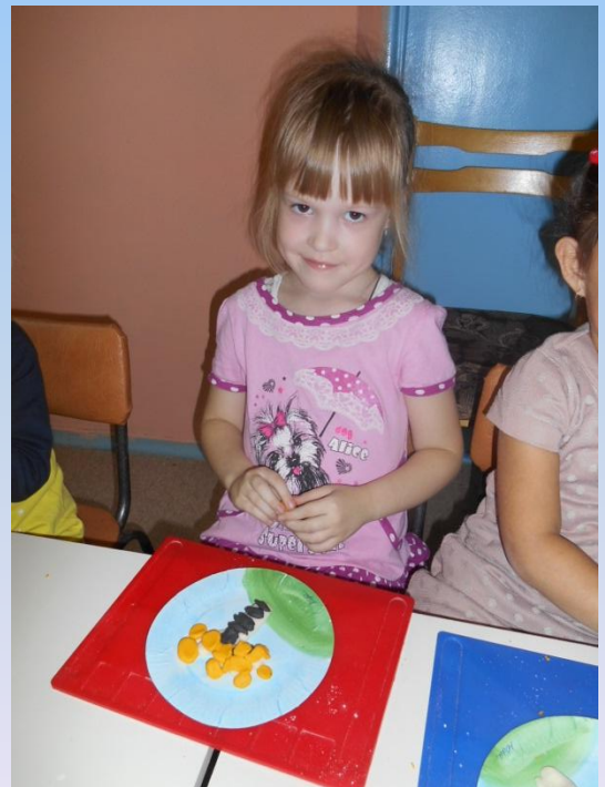
«Осенняя березка». Лепка из соленого теста. Младшие и средние группы.