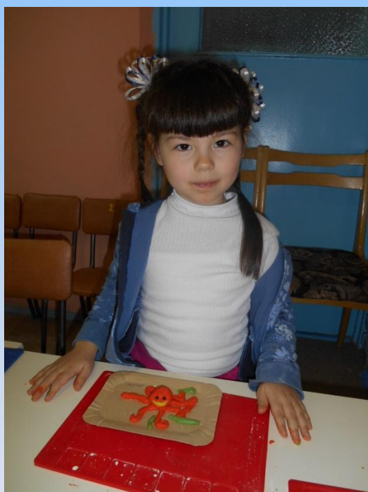
«Осьминог». Лепка из соленого теста Младшие и средние группы.