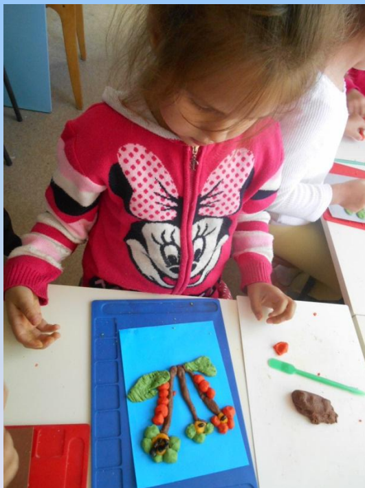
«Осенний букет». Лепка из соленого теста. Старшие и подготовительные группы.