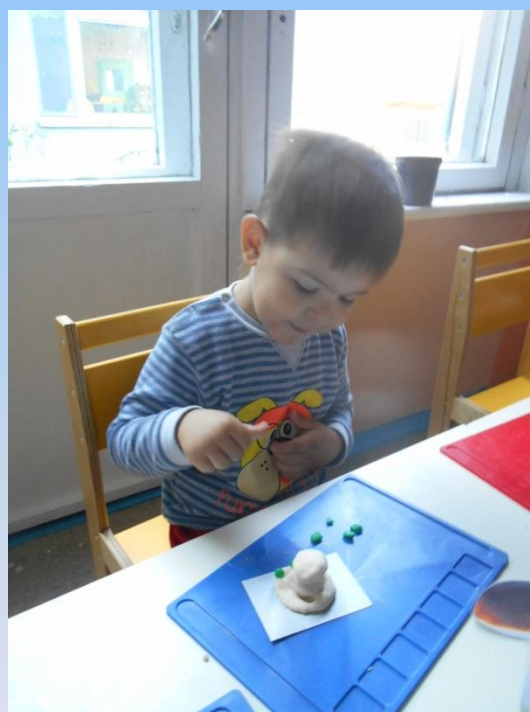
«Грибочки». Лепка из соленого теста Младшие группы.