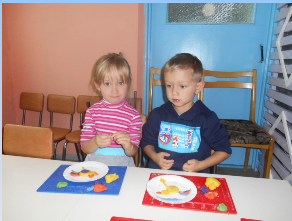
«Петушок – золотой гребешок». Лепка из соленого теста Старшие группы.