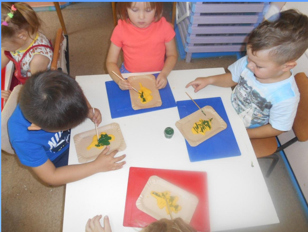
«Дубовые листья». Лепка из соленого теста Младшие и средние группы.