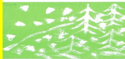
■ Никита 2.5 года