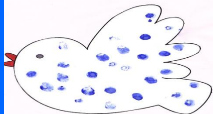
■ Саша 1.8 года