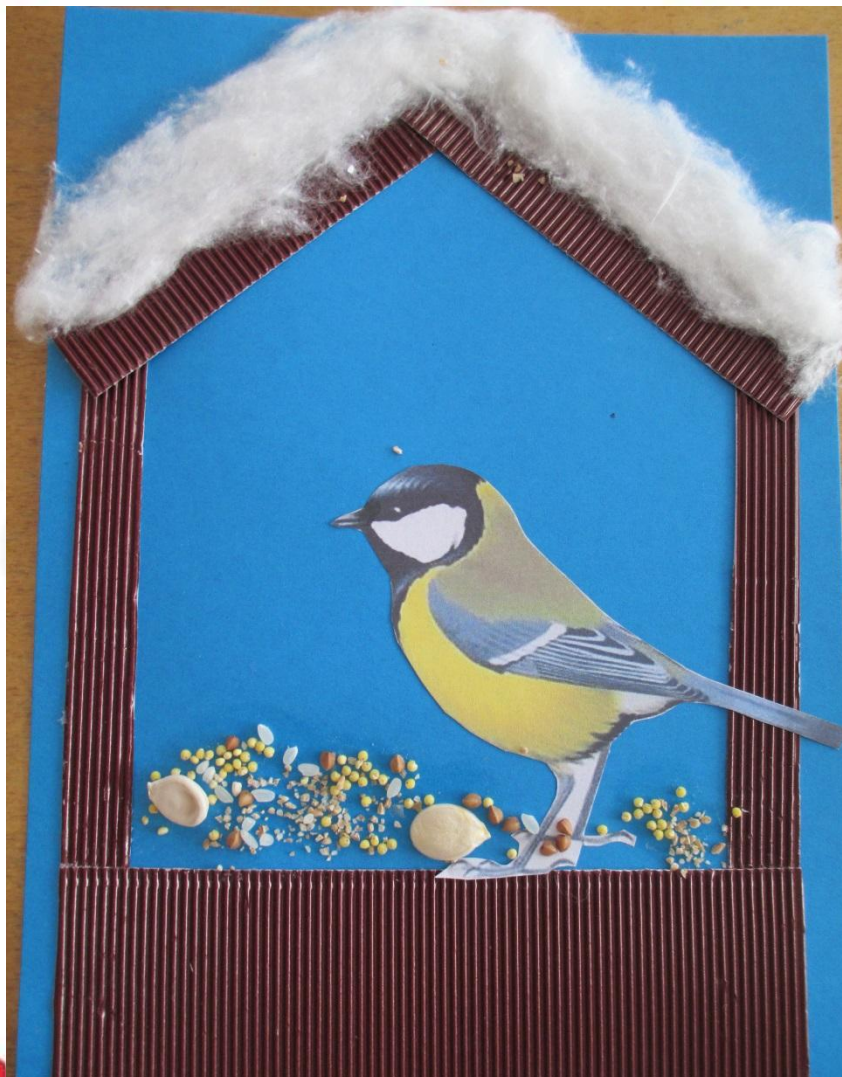
Скворечник для птиц