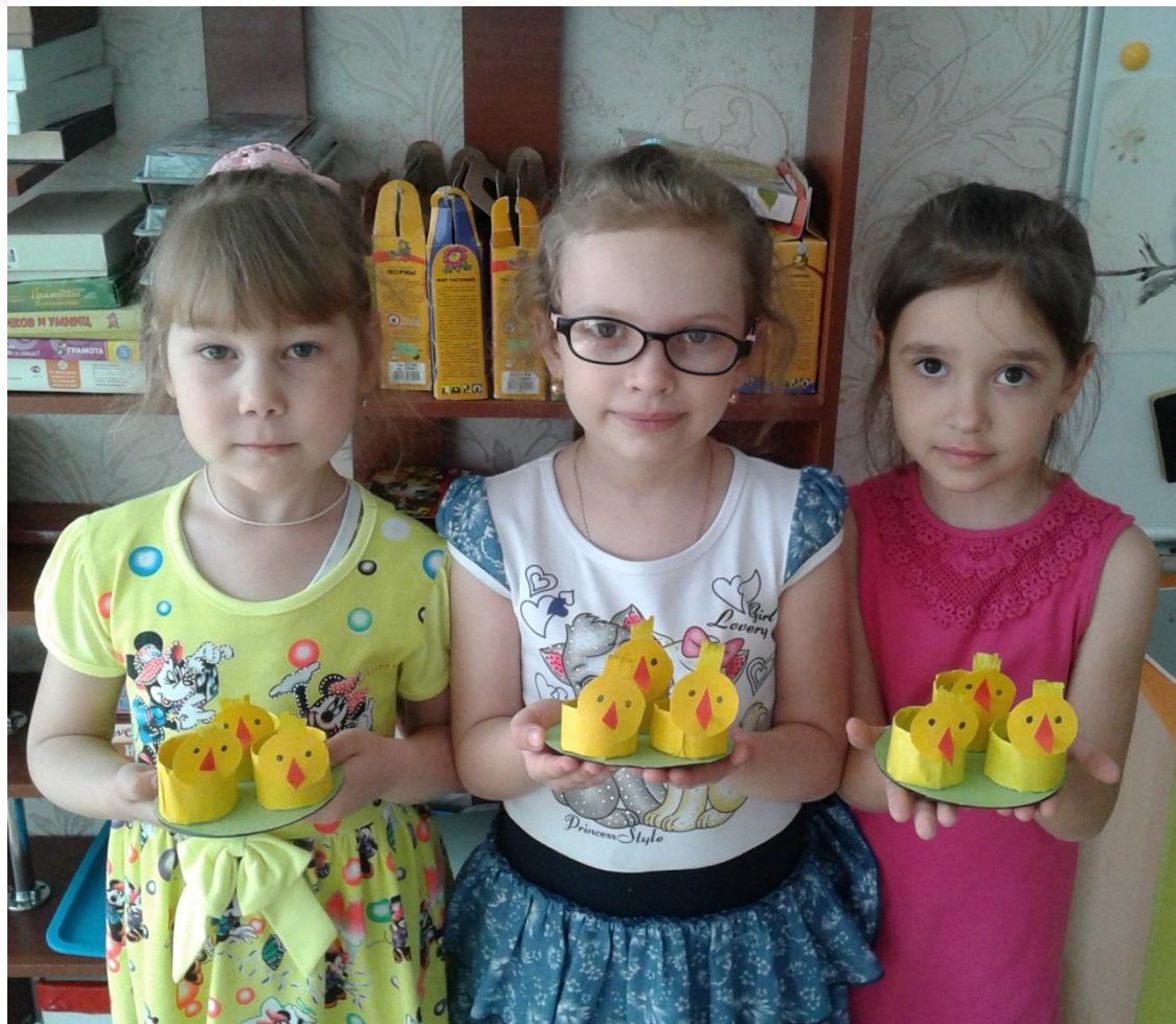
Подставка для пасхального яйца