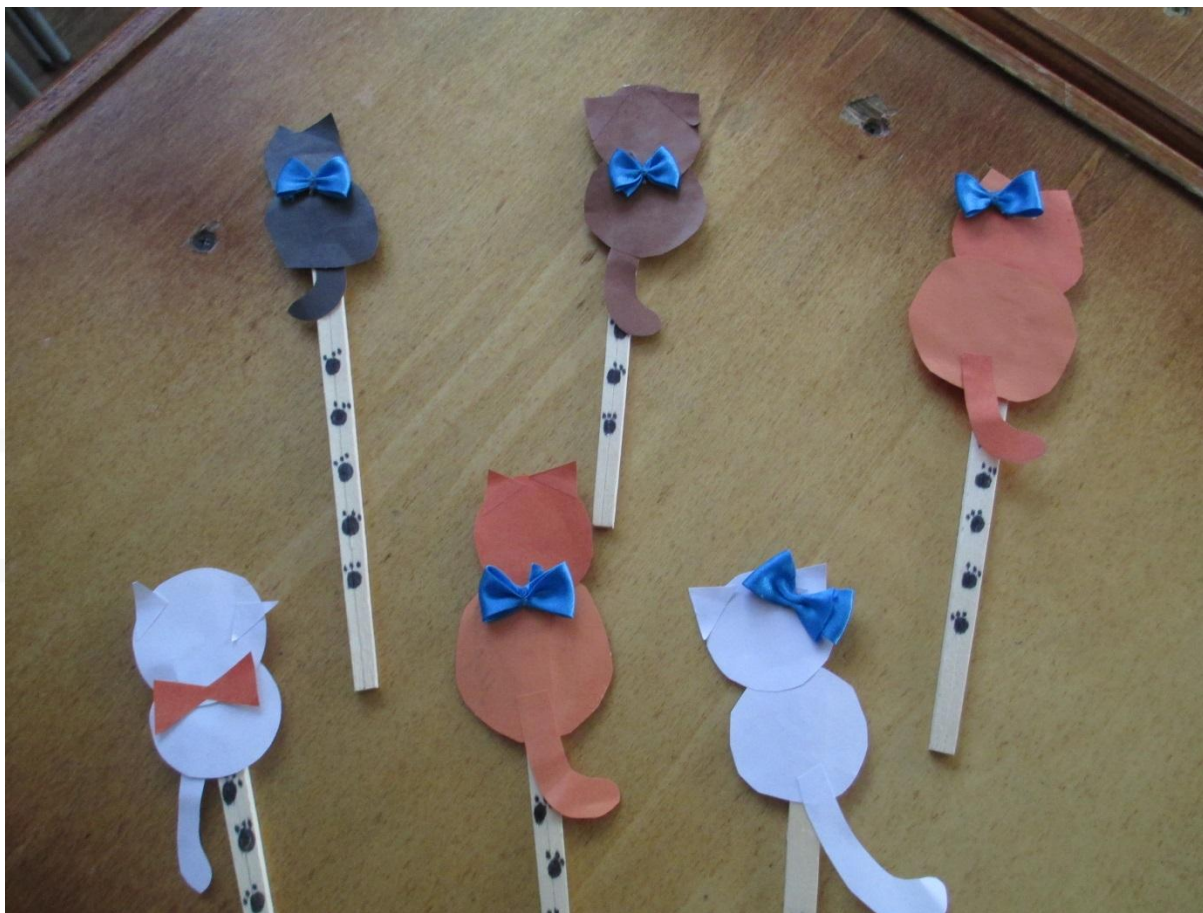
Закладка для книг «Котенок»