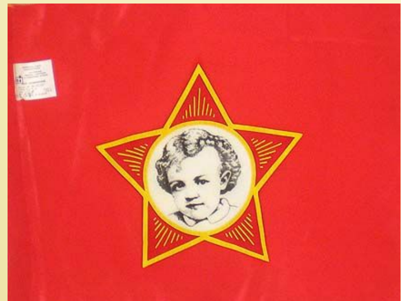
Флажок октябрятского отряда