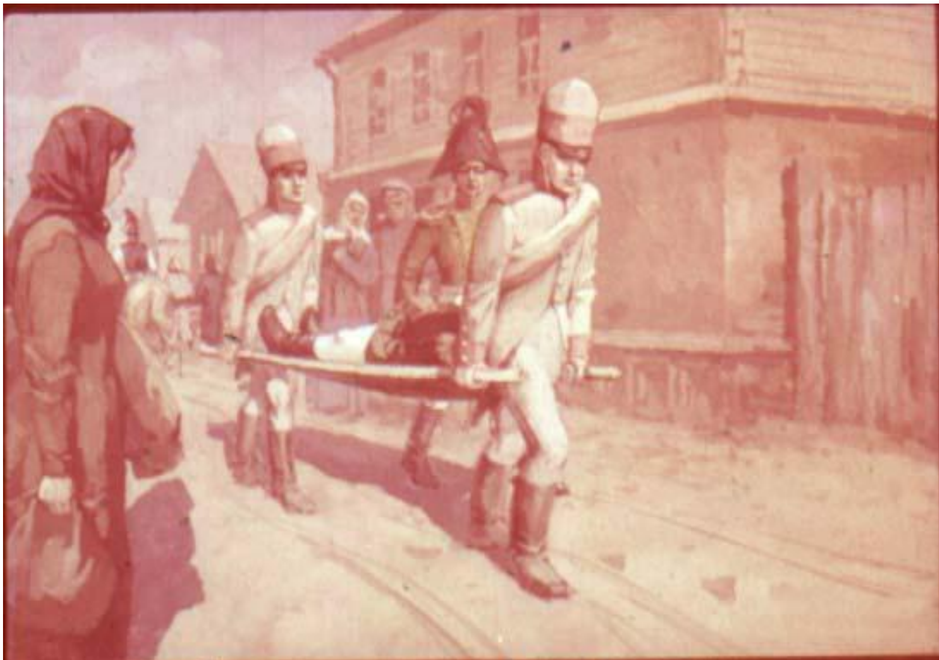
Пришли санитары, забрали полковника.