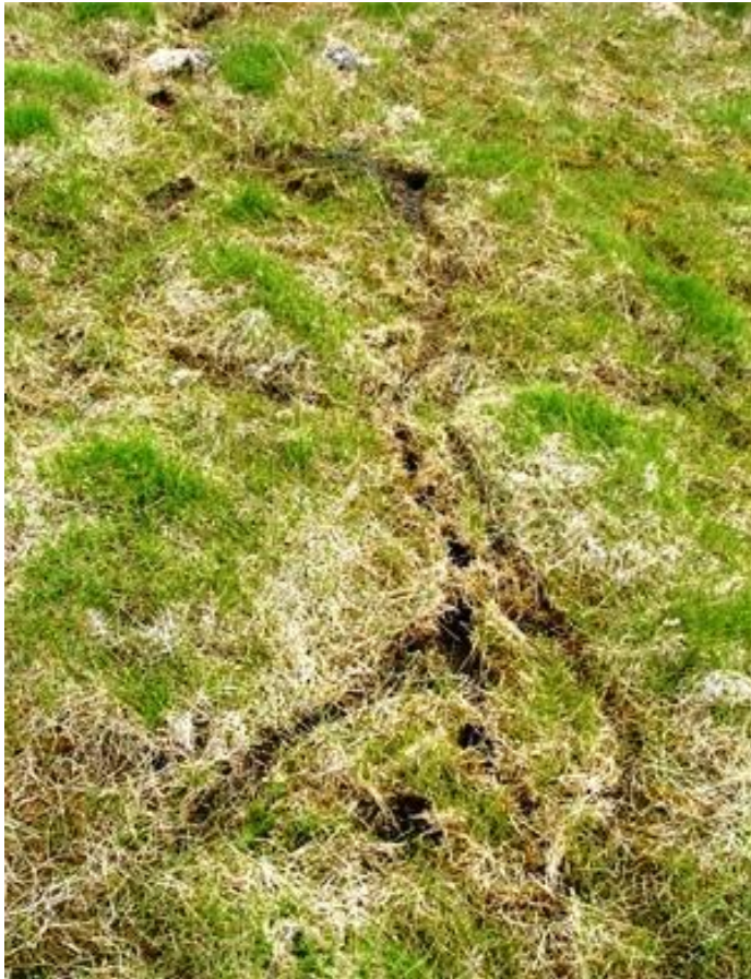
ХОДЫ ЛЕММИНГА, ВЫРЫТЫЕ ЗА ЗИМУ