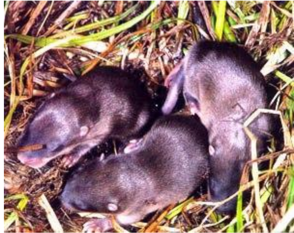
ДЕТЁНЫШИ, РОДИВШИЕСЯ ЗИМОЙ