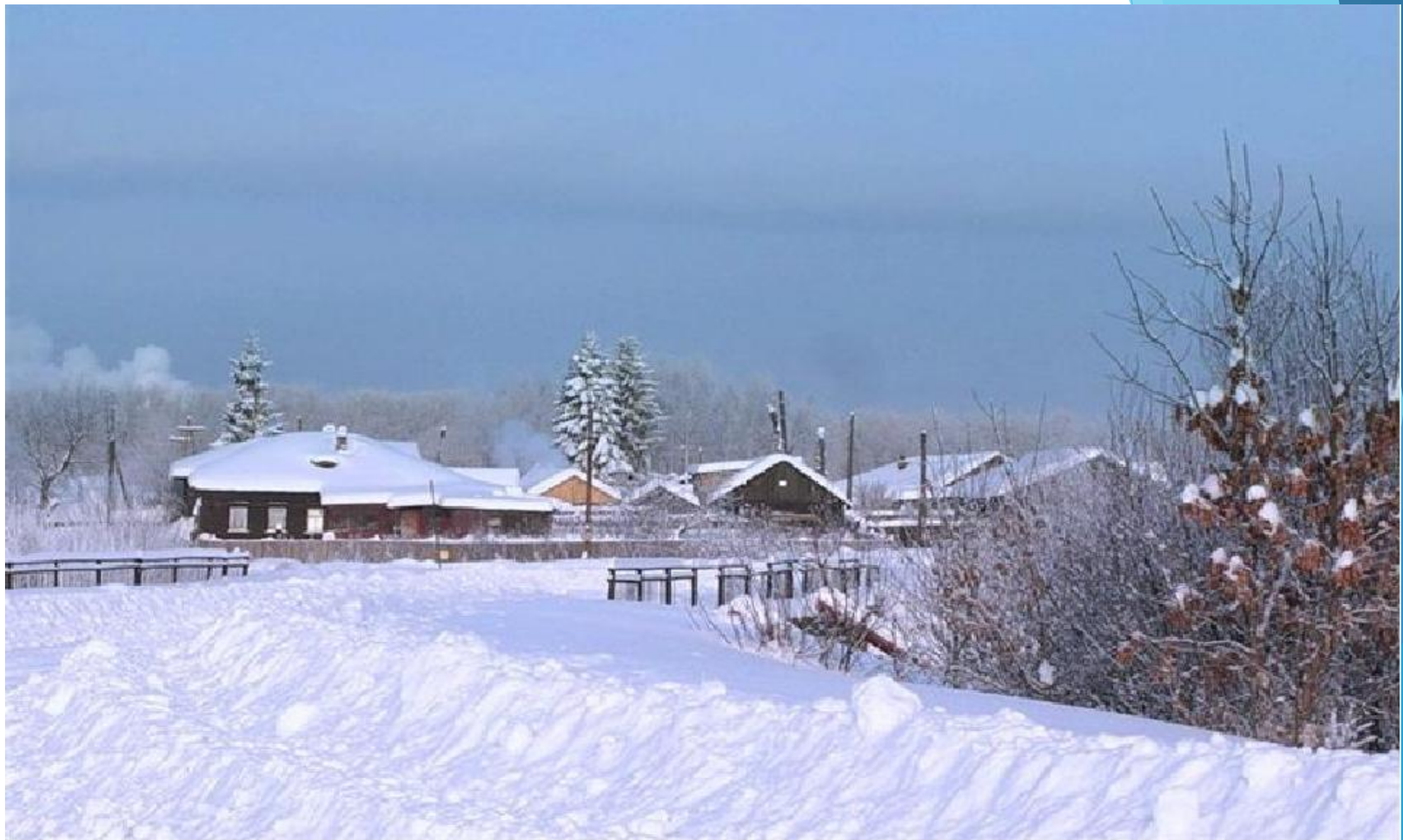
Дымковская слободка сегодня