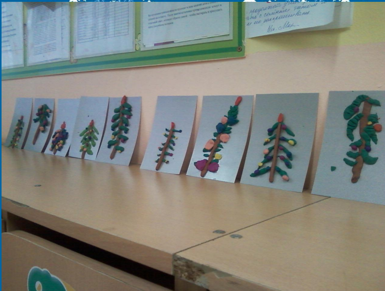
Наши новогодние красавицы