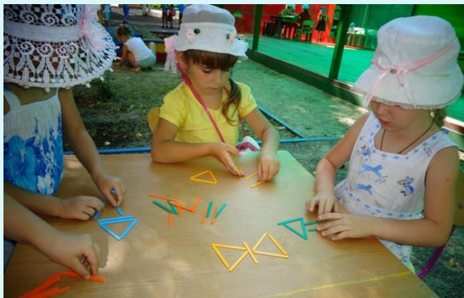
«Кто быстрее соберет бабочку»