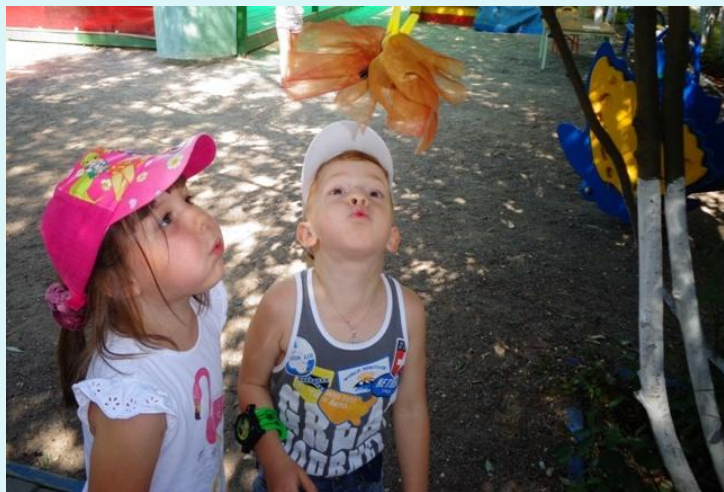
«Чья бабочка выше улетит»