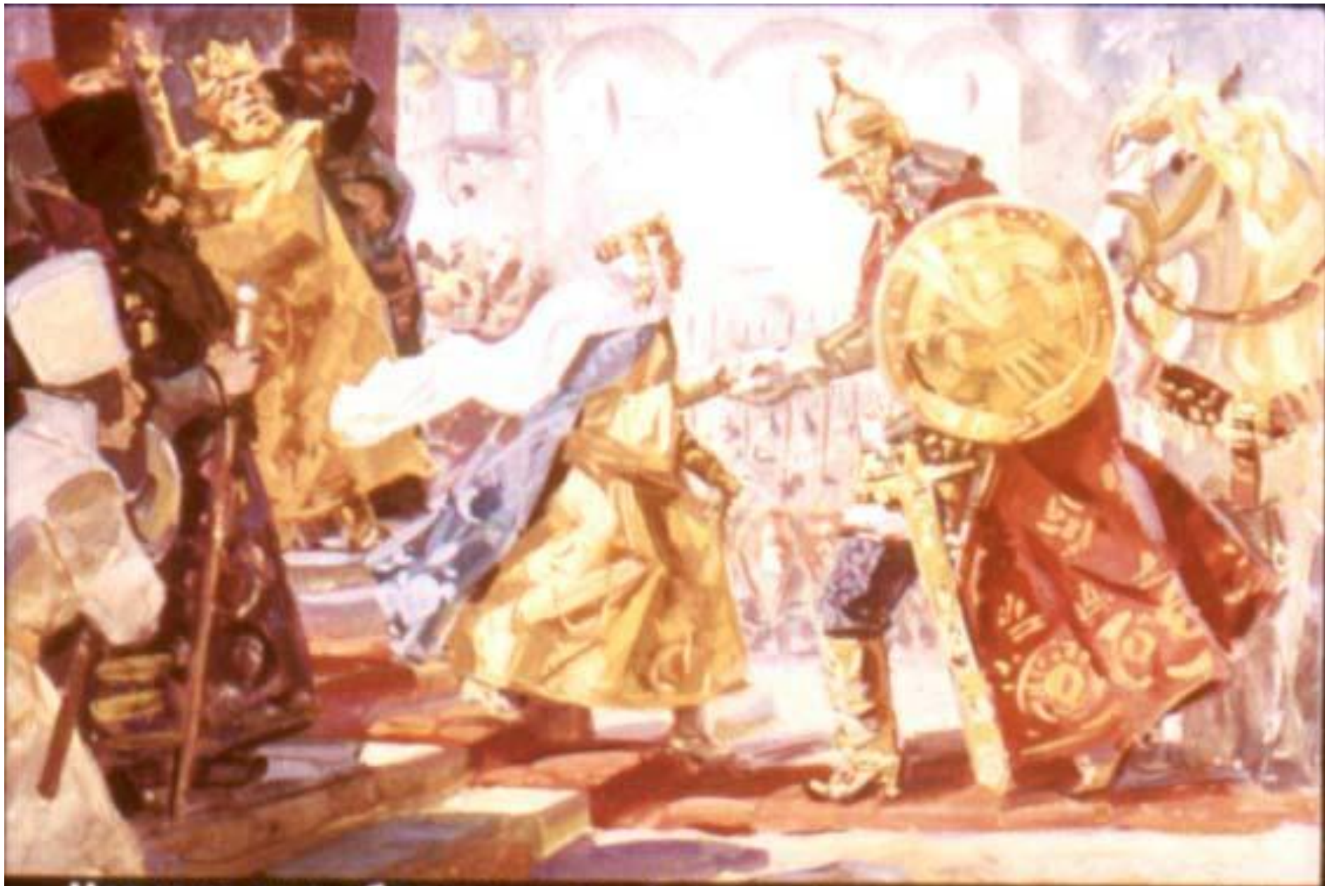
Царевна ему обрадовалась. А царь испугался слово нарушить. Тут и свадьбу сыграли!