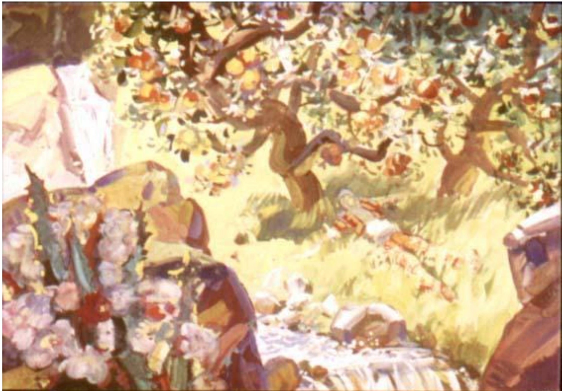
Набрал живой воды. Набрал и притомился. Спит Скороход, 27