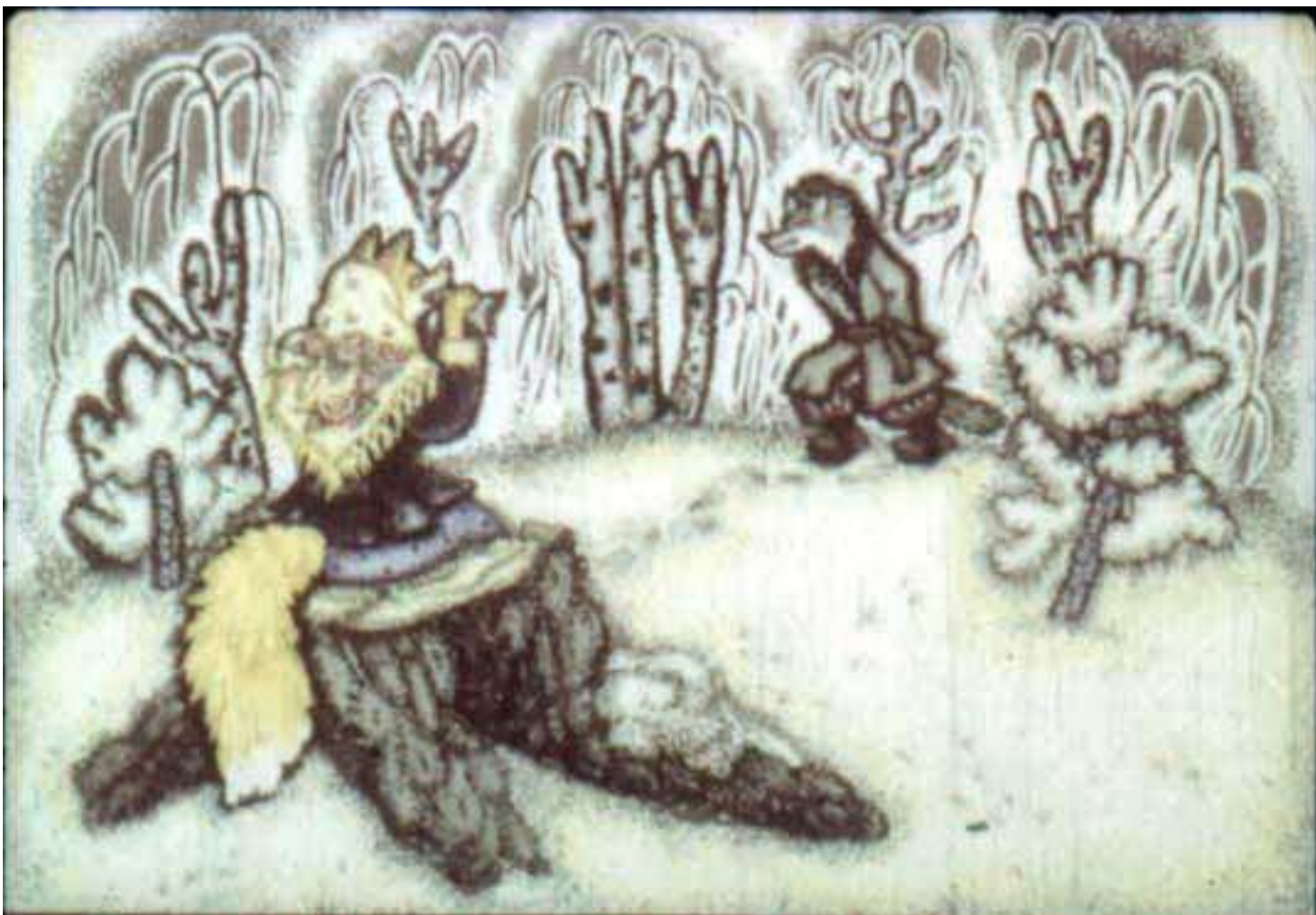
Видит лиса – бежит волк. От голода у него бока подвело. [14]