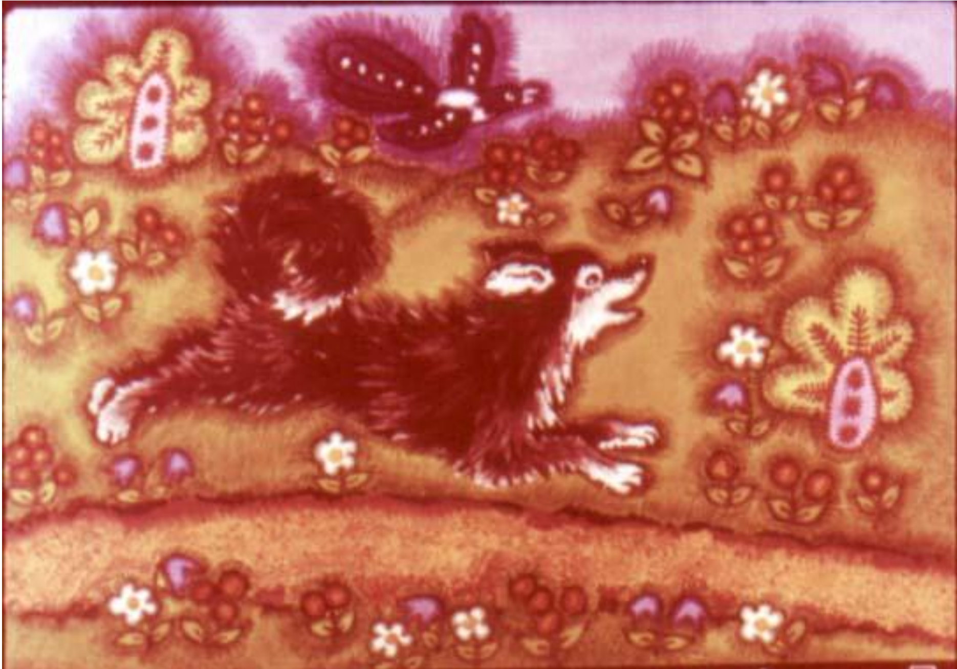
А собана высночила из мешна да за ней.