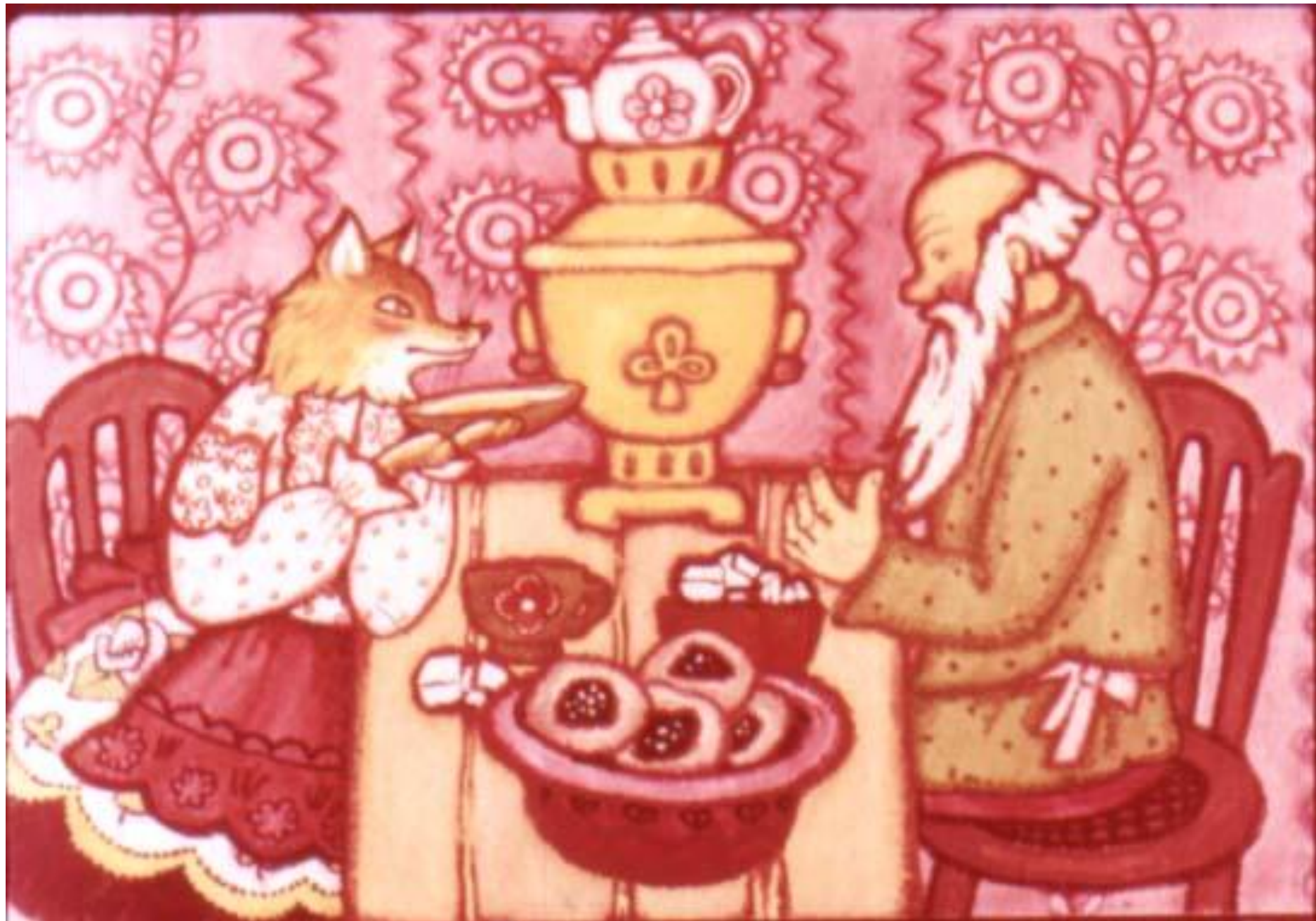
Он её и пустил.