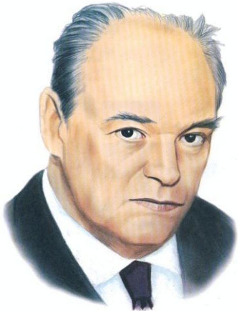
Чарушин Евгений Иванович (1901-1965)