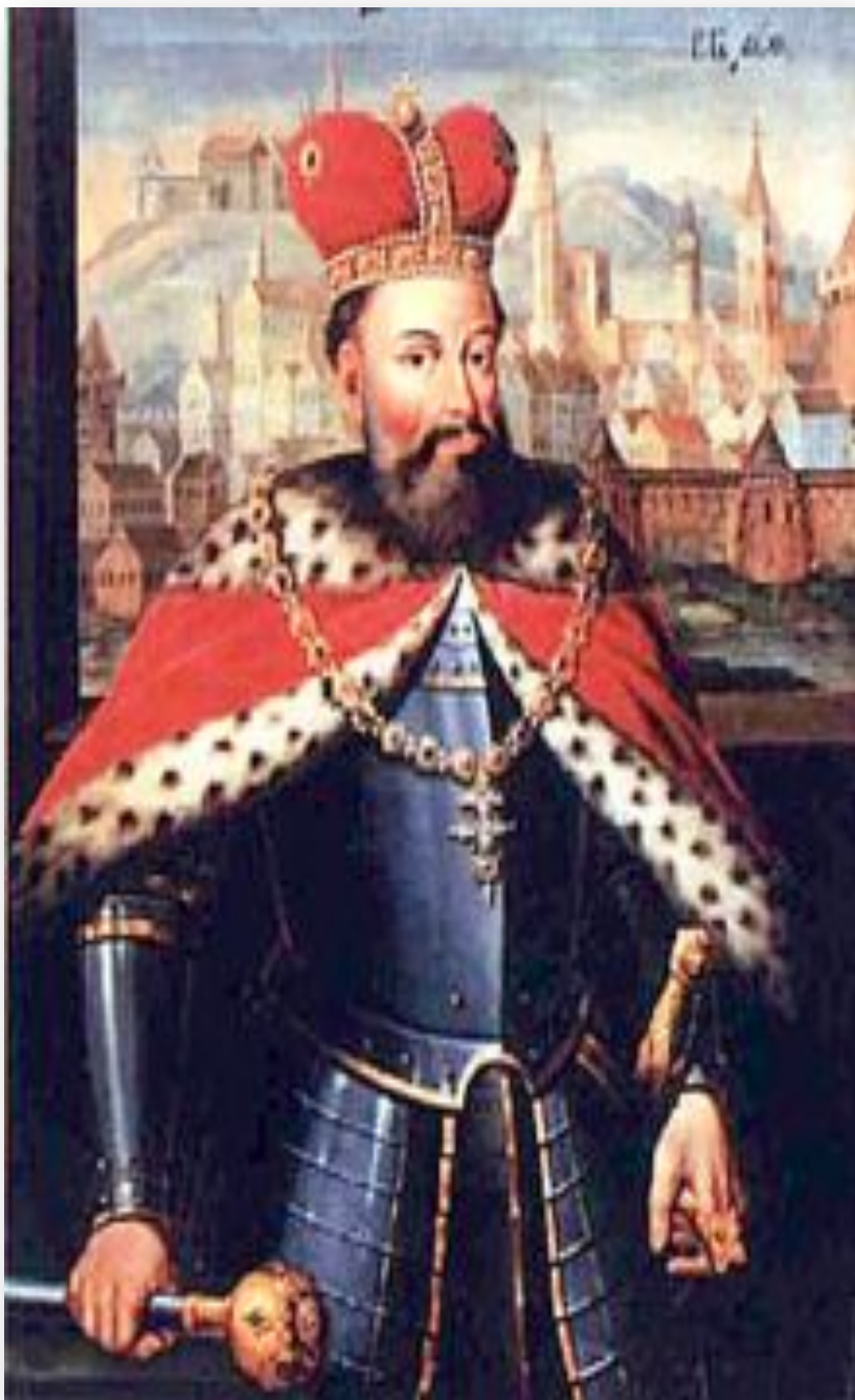
Король Лев Данилович на фоні Львова. Портрет 17 століття.