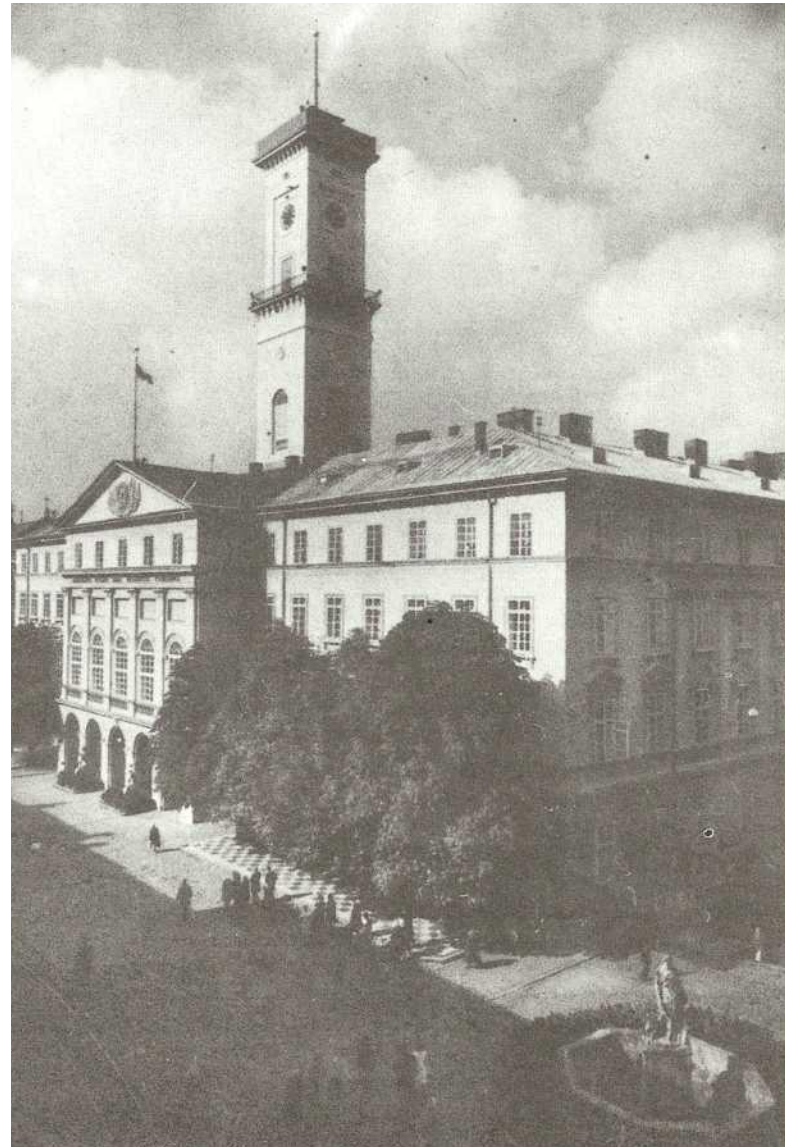
Львівська ратуша, кінець 80-х рр.