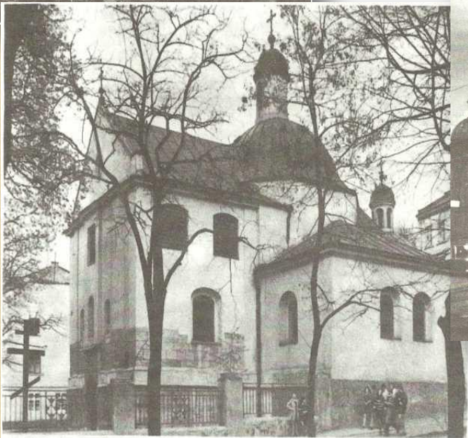
Церква св. Миколая