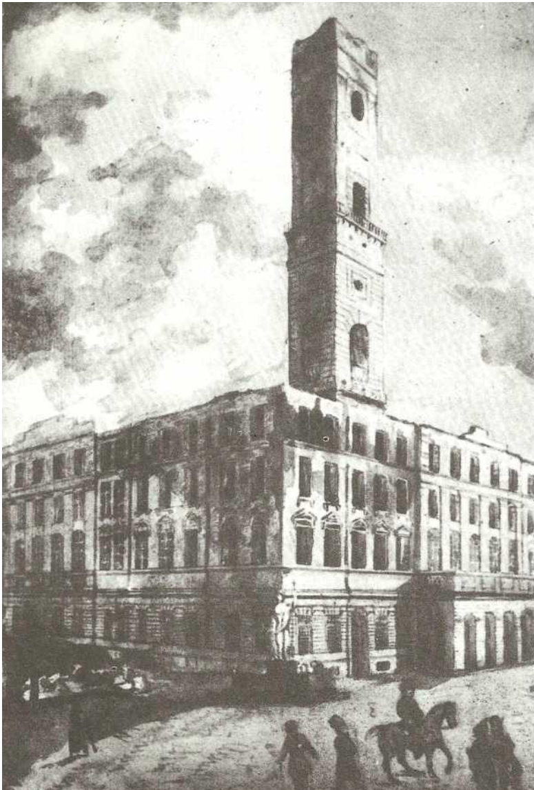
Ратуша після революції, 1848р.