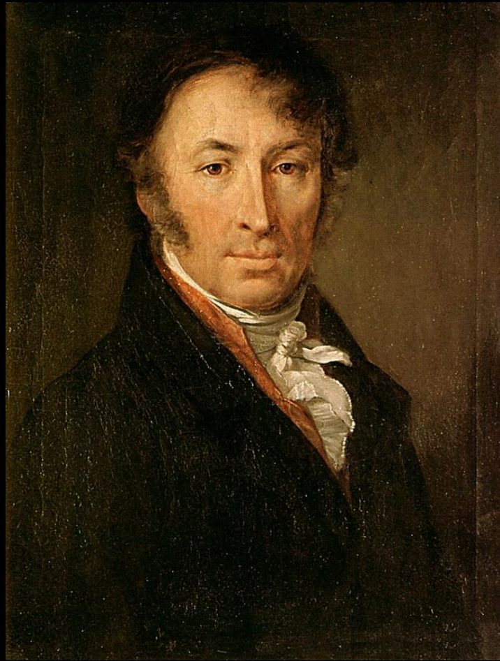
Н. И. Карамзин

Любовь к Отечеству должна ослеплять нас и уверять, что мы во всём лучшие.