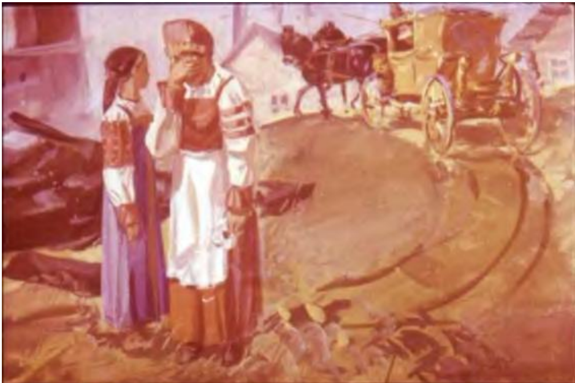
Барыня тут же отдала деньги, подхватила шнатулку и айда домой.