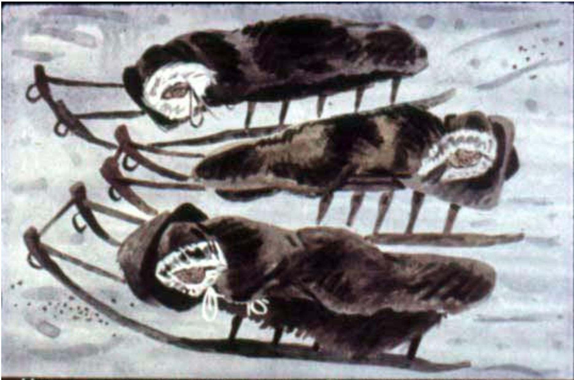
Ночью хозяин дал людям отдых. Заснули на нартах в тёплых мешках богатеи.