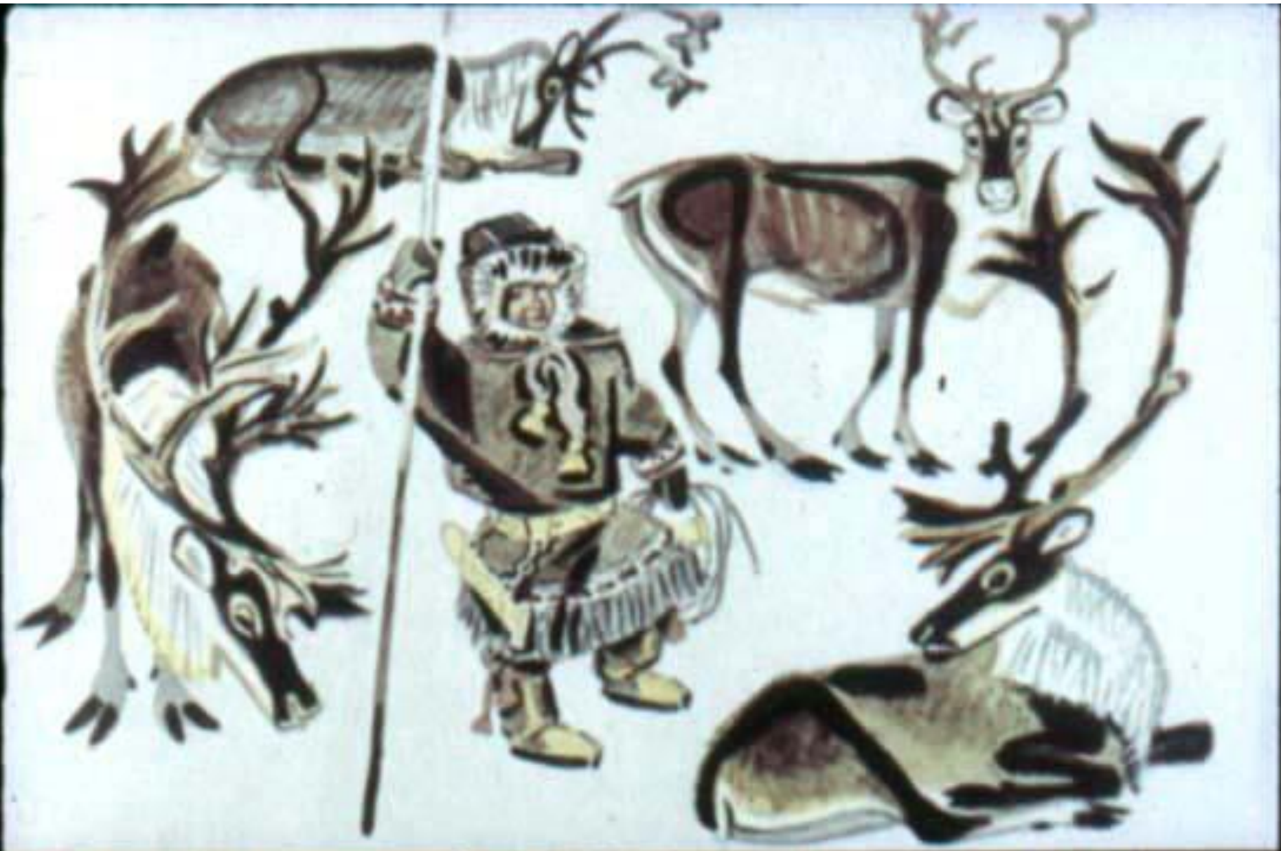
Замер от счастья Ануто. Значит, стадо погонят к чумам, значит, будут делить оленей.