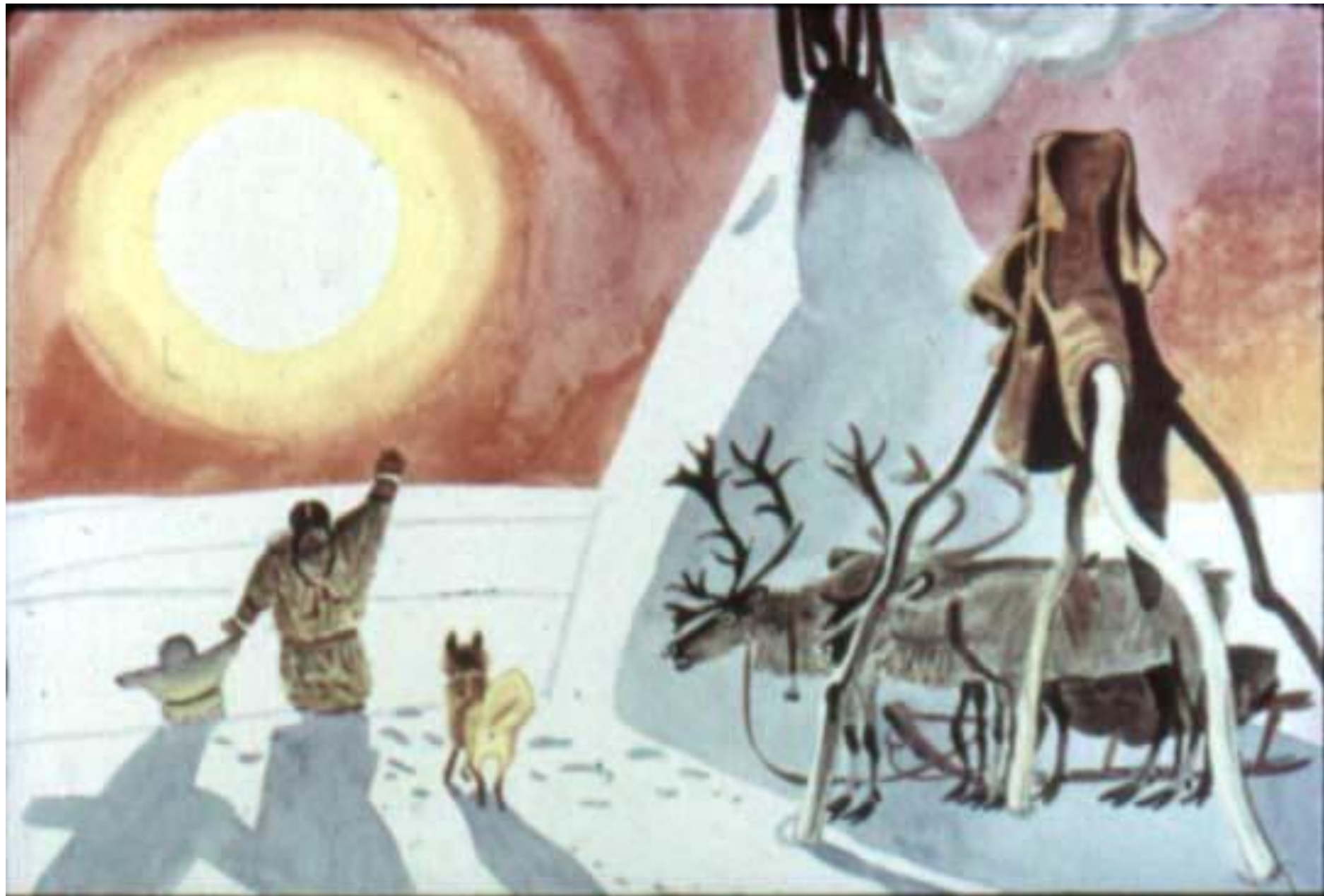
Солнце поднялось над тундрой. Искрится под солнцем снег.