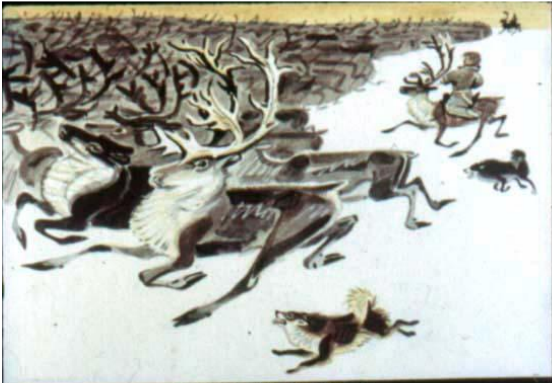
Стадо бенит по тундре.