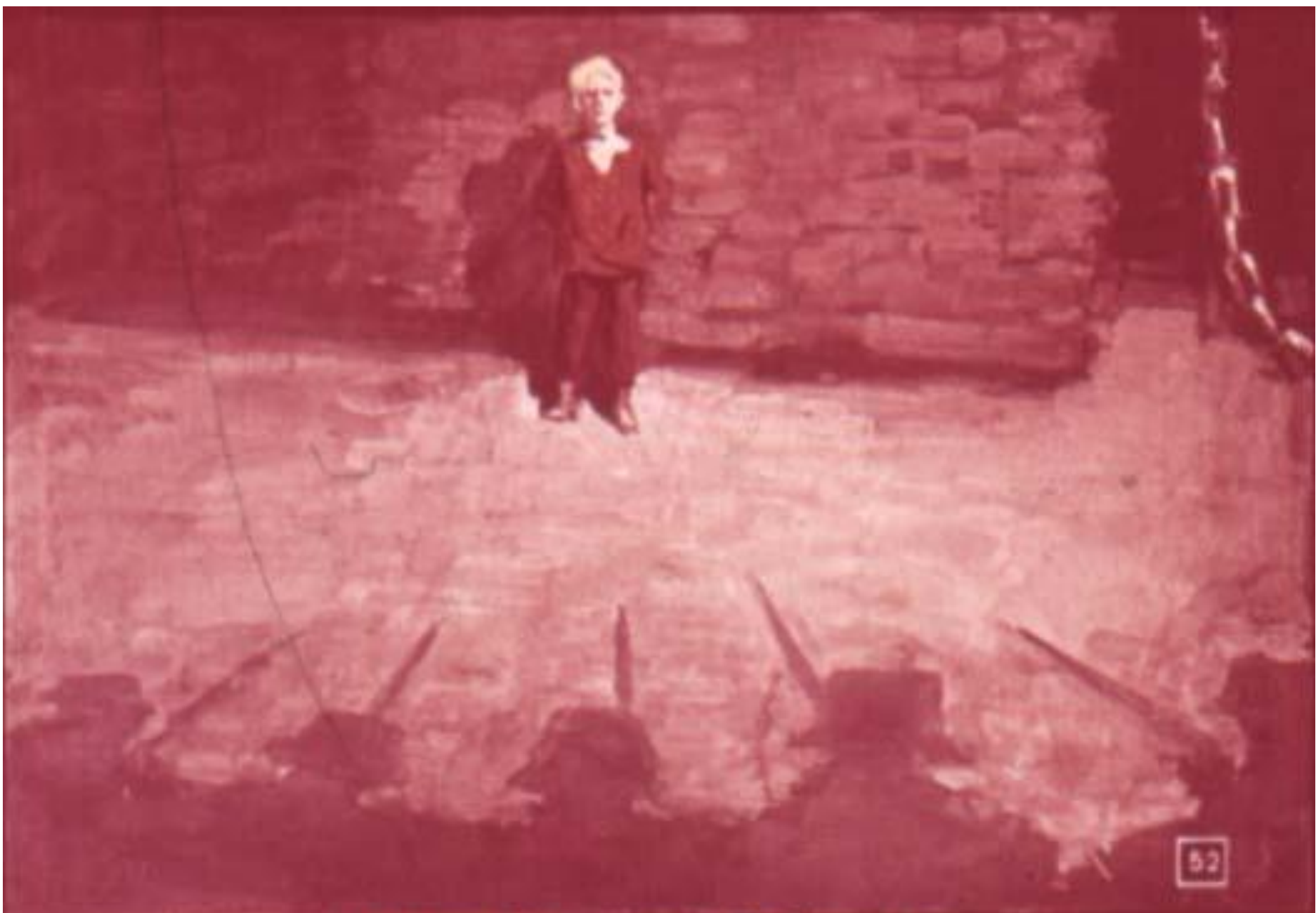
И погиб Мальчиш-Кибальчиш...