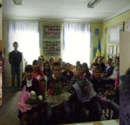
об'єднання Зустріч з вчителями- пенсіонерами