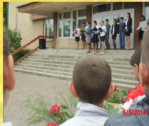
Урочиста лінійка до Дня