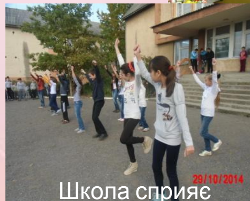
Школа сприяє здоров'ю