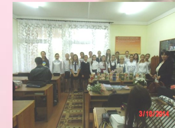
Привітання до Дня Вчителя