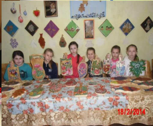
Робота дитячого об'єднання