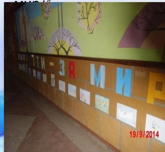
Виставка малюнків "Ми – за мир!"