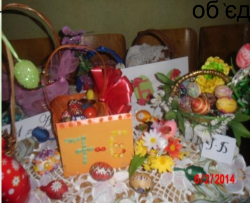
Конкурс “Воскресни, писанко”