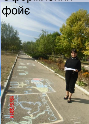
Підведення підсумків конкурсу