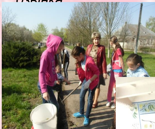
Акція "Чисте довкілля"