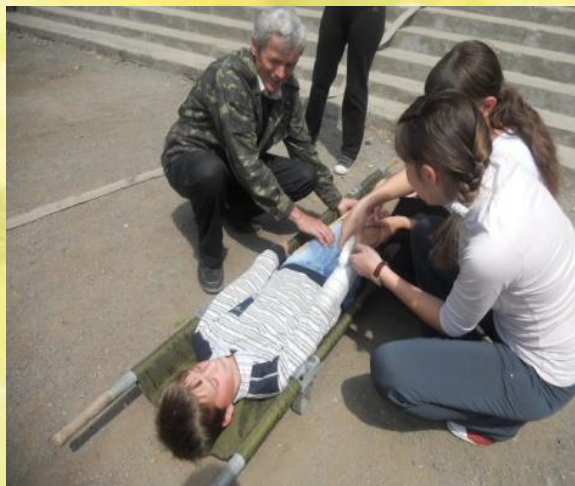
День Цивільної оборони