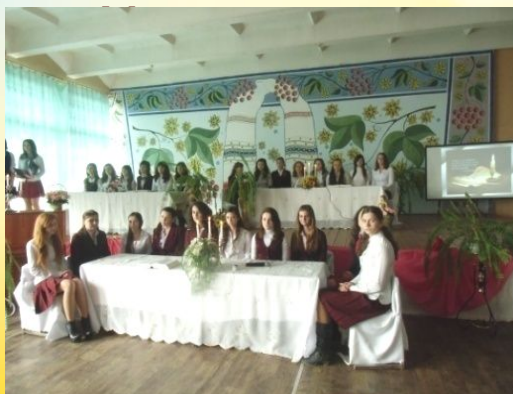
Вечір до Дня святого Валентина