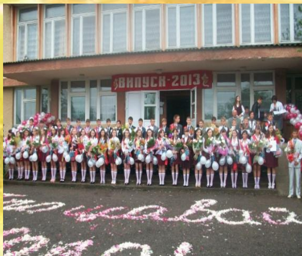
Свято Останнього дзвінка