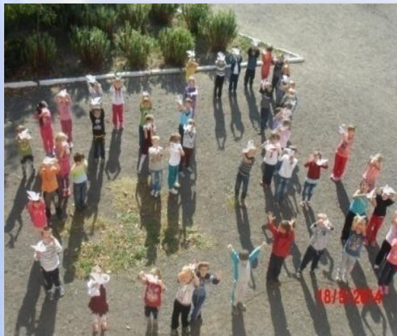
Флешмоб "Голуб за мир!"