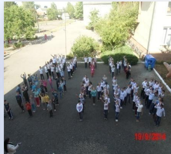
Флешмоб "Діти - за мир!"