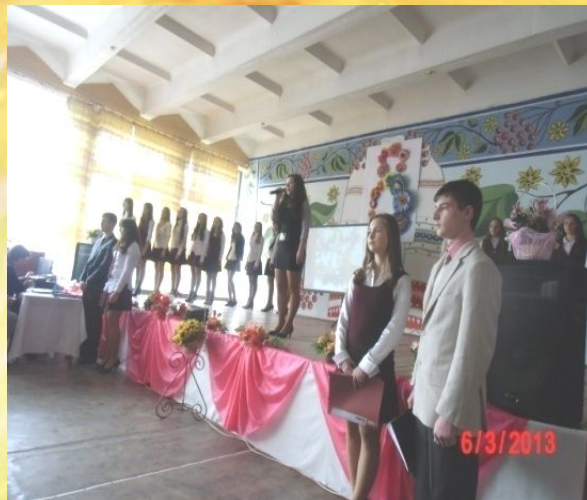
Свято 8 Березня