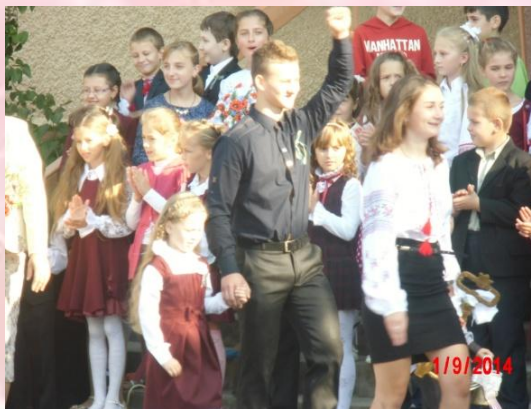
Свято Першого дзвінка