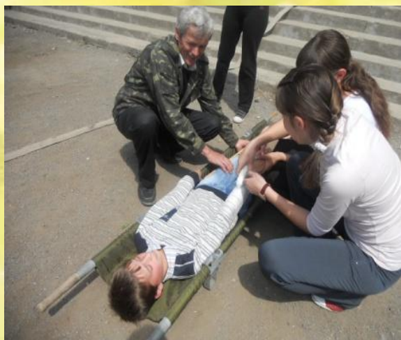
День Цивільної оборони