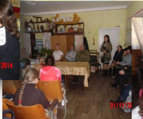
Зустріч з учасниками АТО