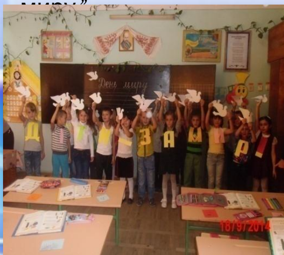
Діти – за мир!