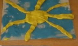
Григорий Самуил Честя