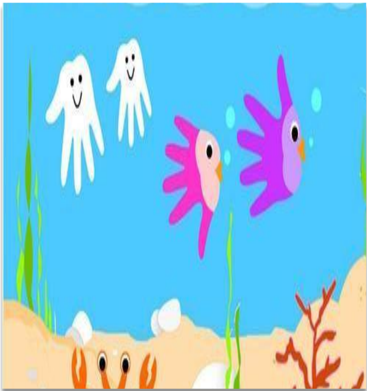
Аппликация из отпечатков ладоней