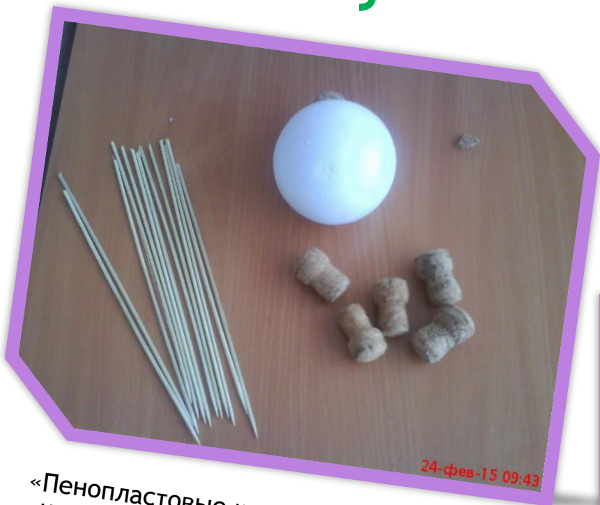
«Пенопластовые шары» «Пробки» «Шампура»