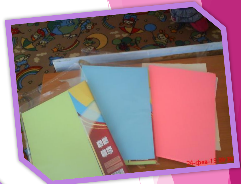
Бумага разных цветов