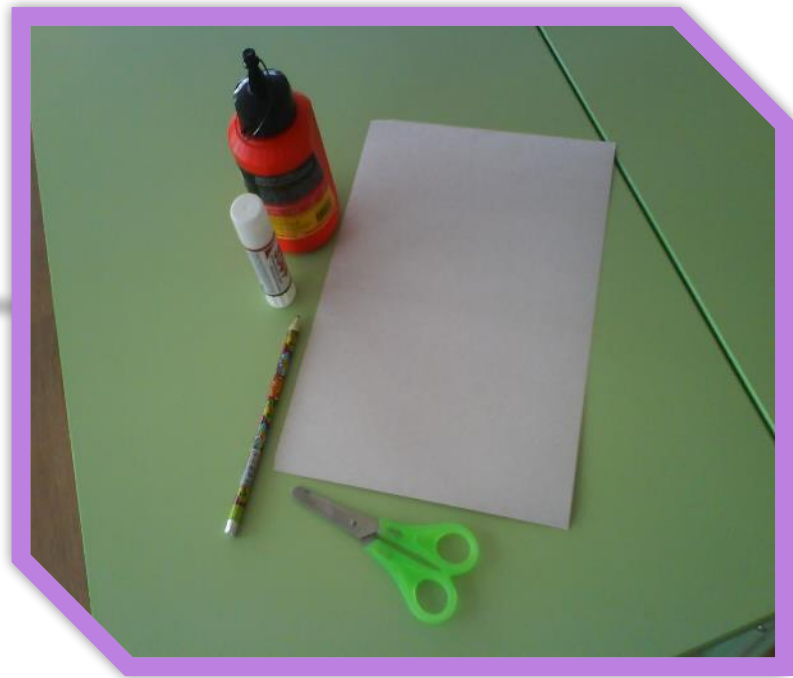
«Клей бумажный, «Момент», ножницы, картон, ножницы, карандаш.