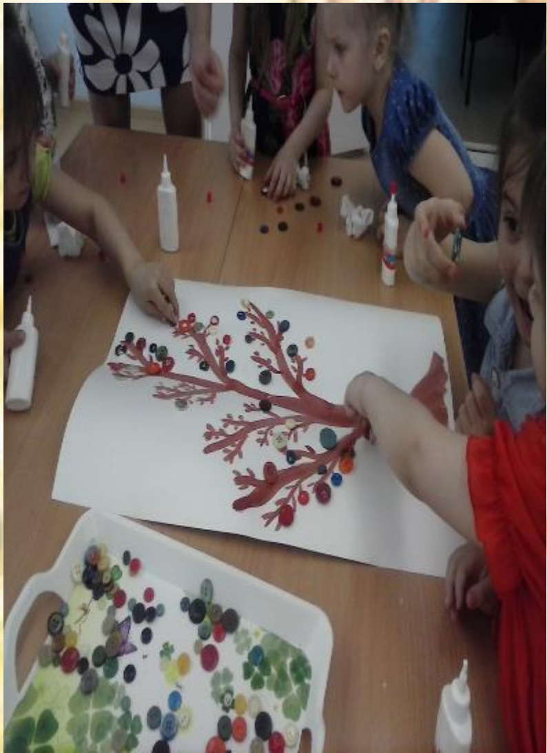
2. Подбор пуговиц. 3. Декорирование готовой поделки.