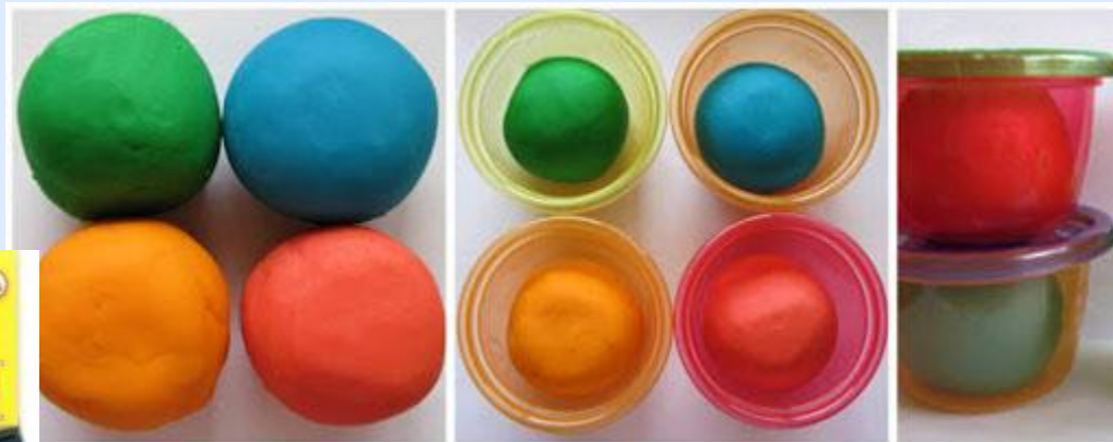
Масса для лепки