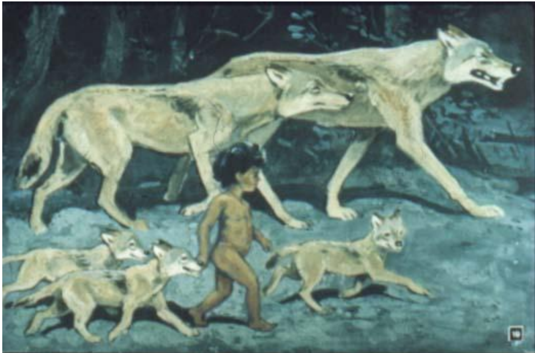
Отец Волк подождал, пока его волчата подросли, и повёл всех волчат, Маугли и Мать Волчицу на Сналу Совета.