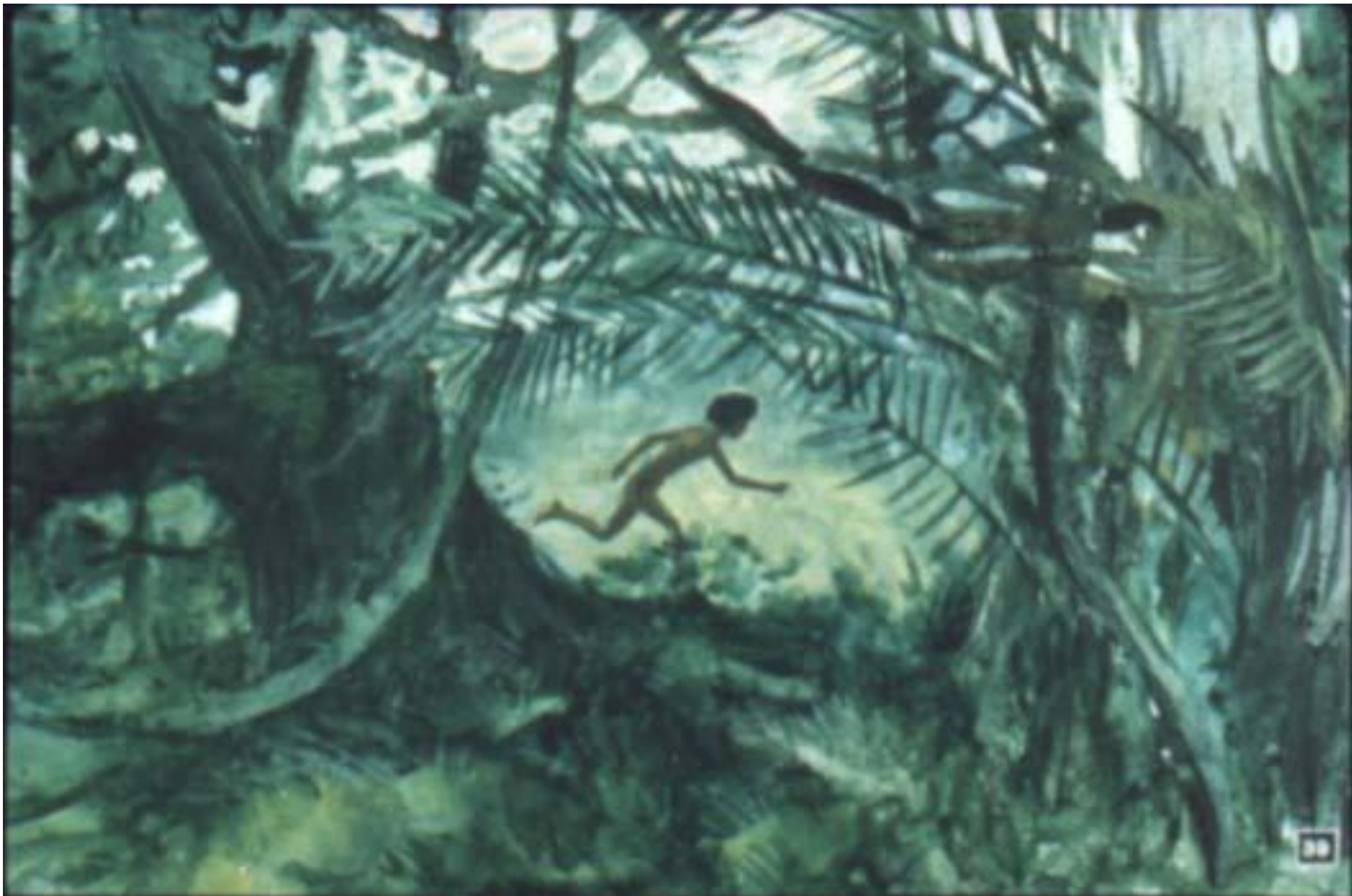
Маугли послушался Багиру и, не мешкая, побегал через кусты к реке на дне долины.