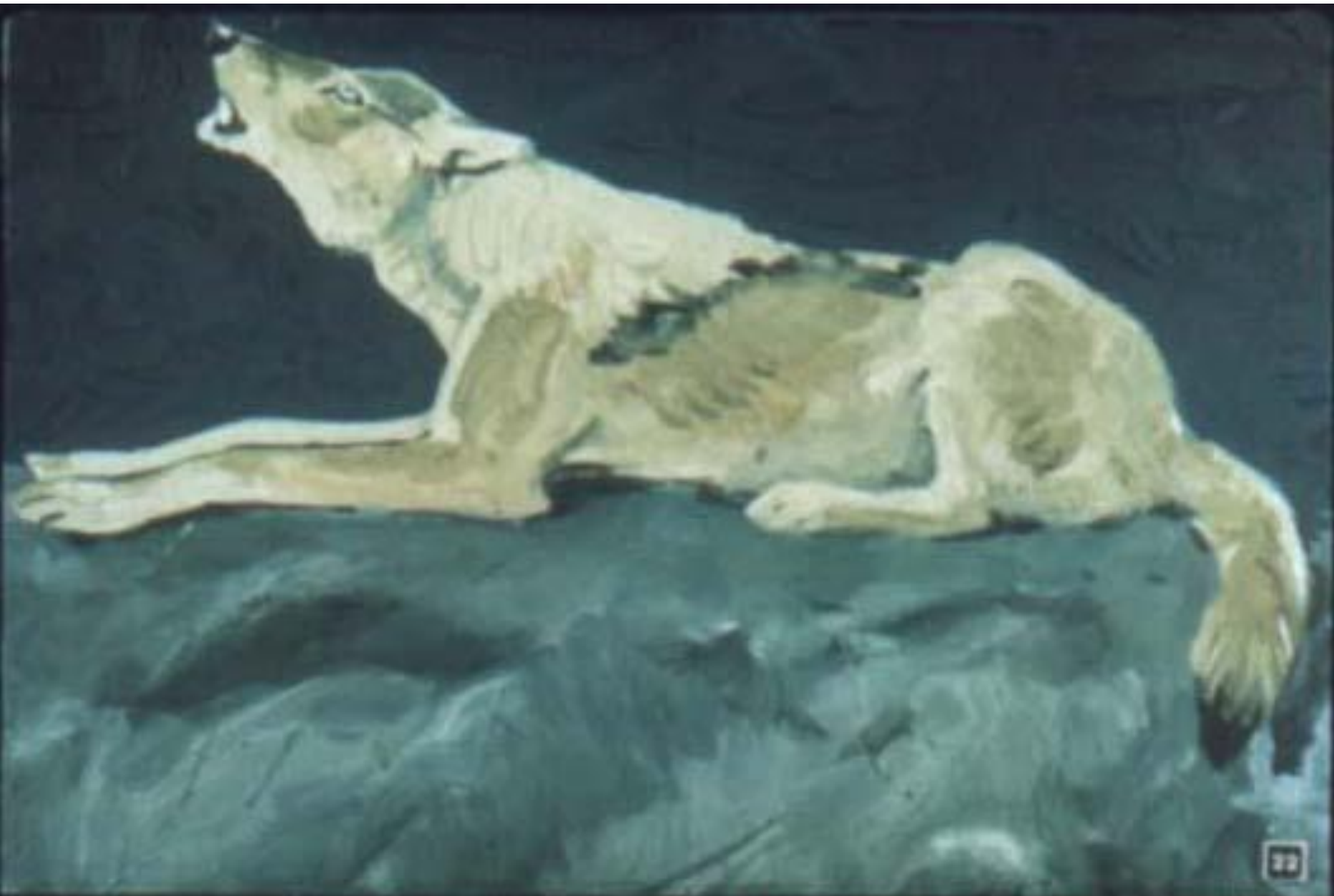
Анела взывал со своей скалы: „Закон вам известен. Хорошенько смотрите, о волки!“