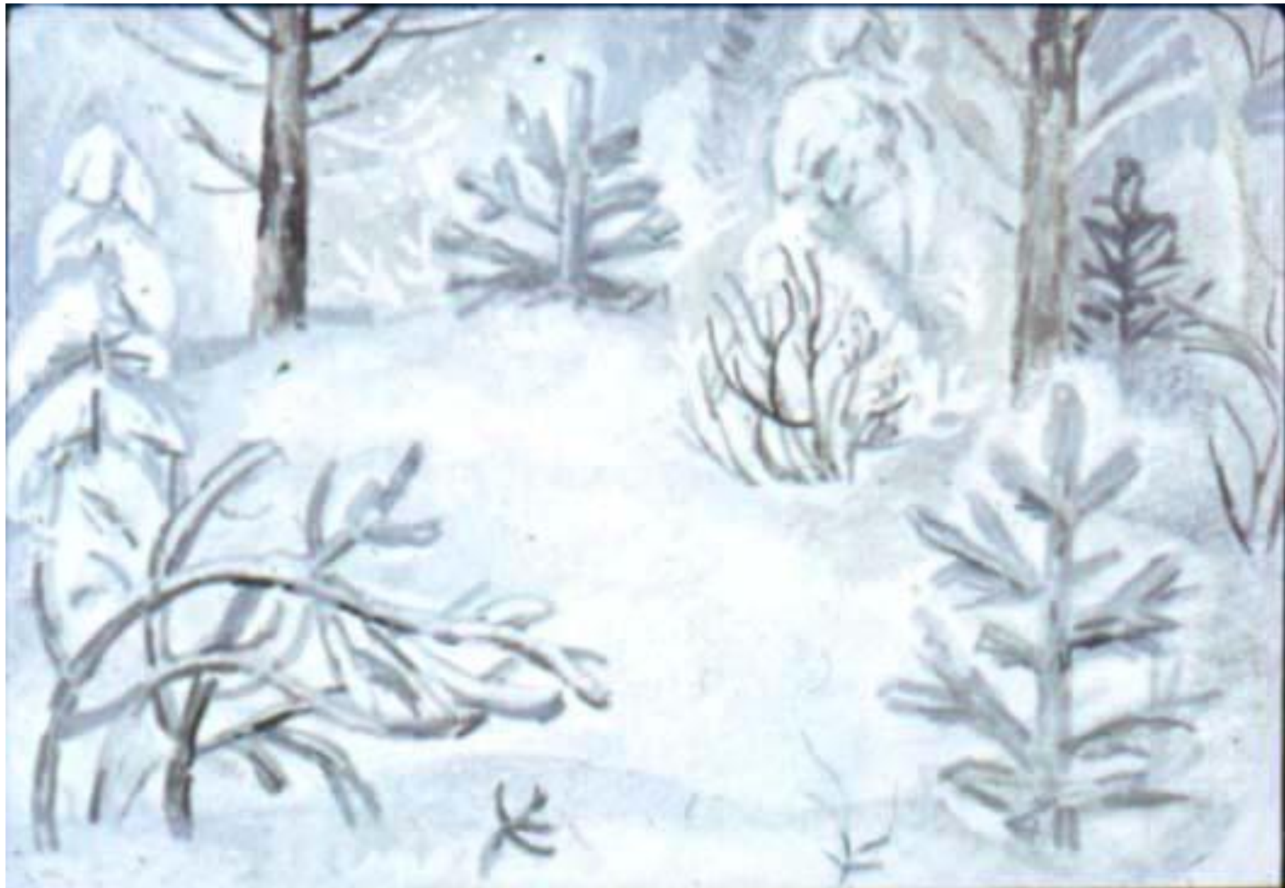
Скоро снег накрыл землю.