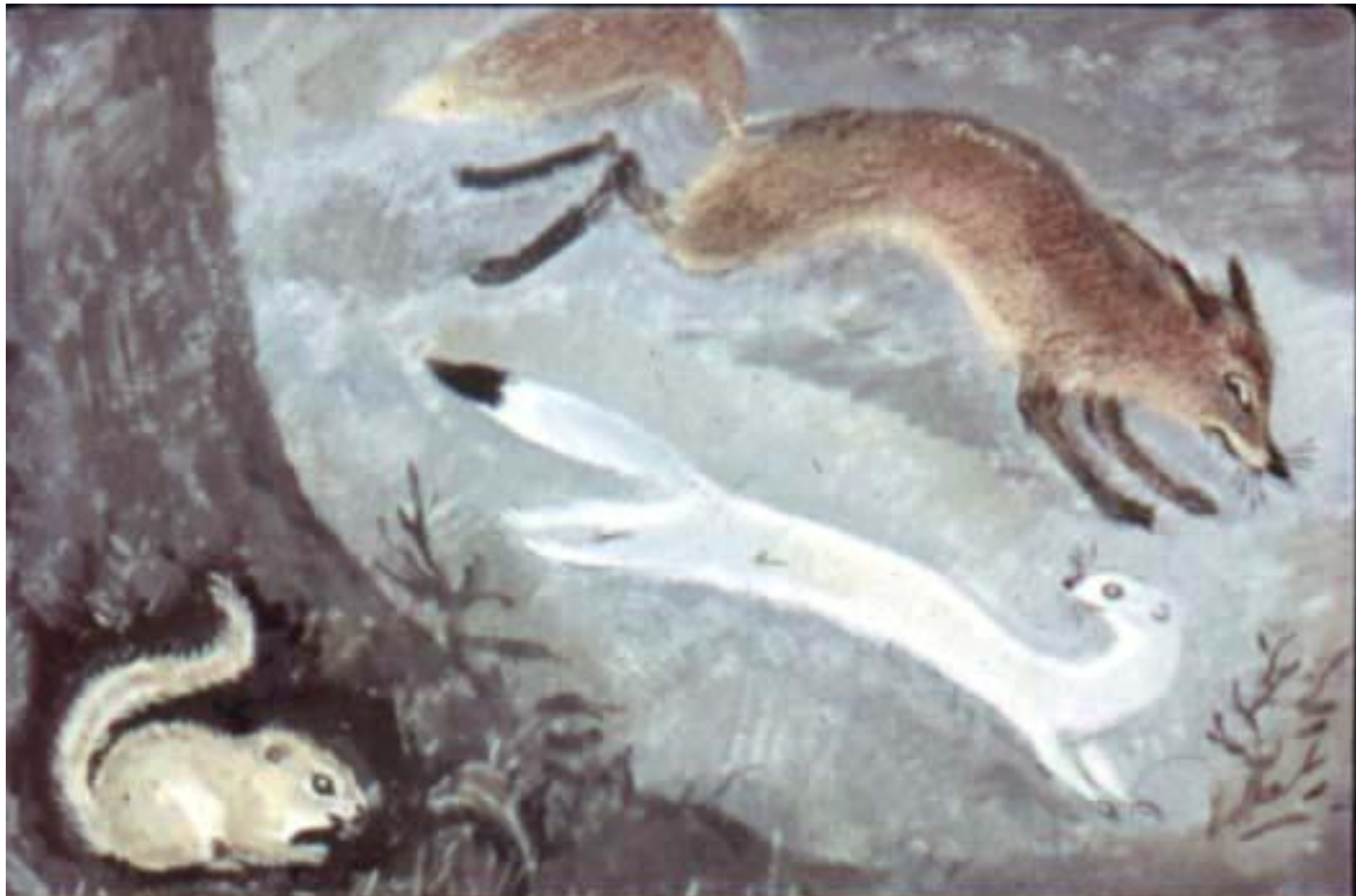
Вот бурндук и решил однажды: найду-ка я друга. Большо-го и сильного. Чтобы его боялись все: и лиса, и горноста́й... [9]