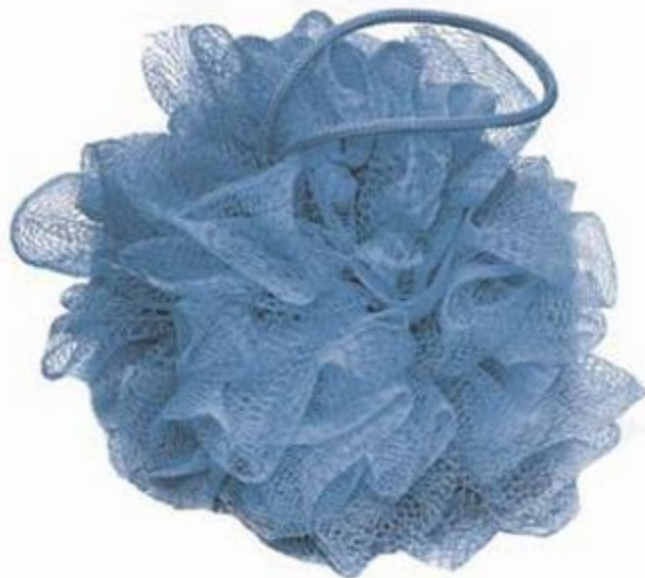
Губка для душа