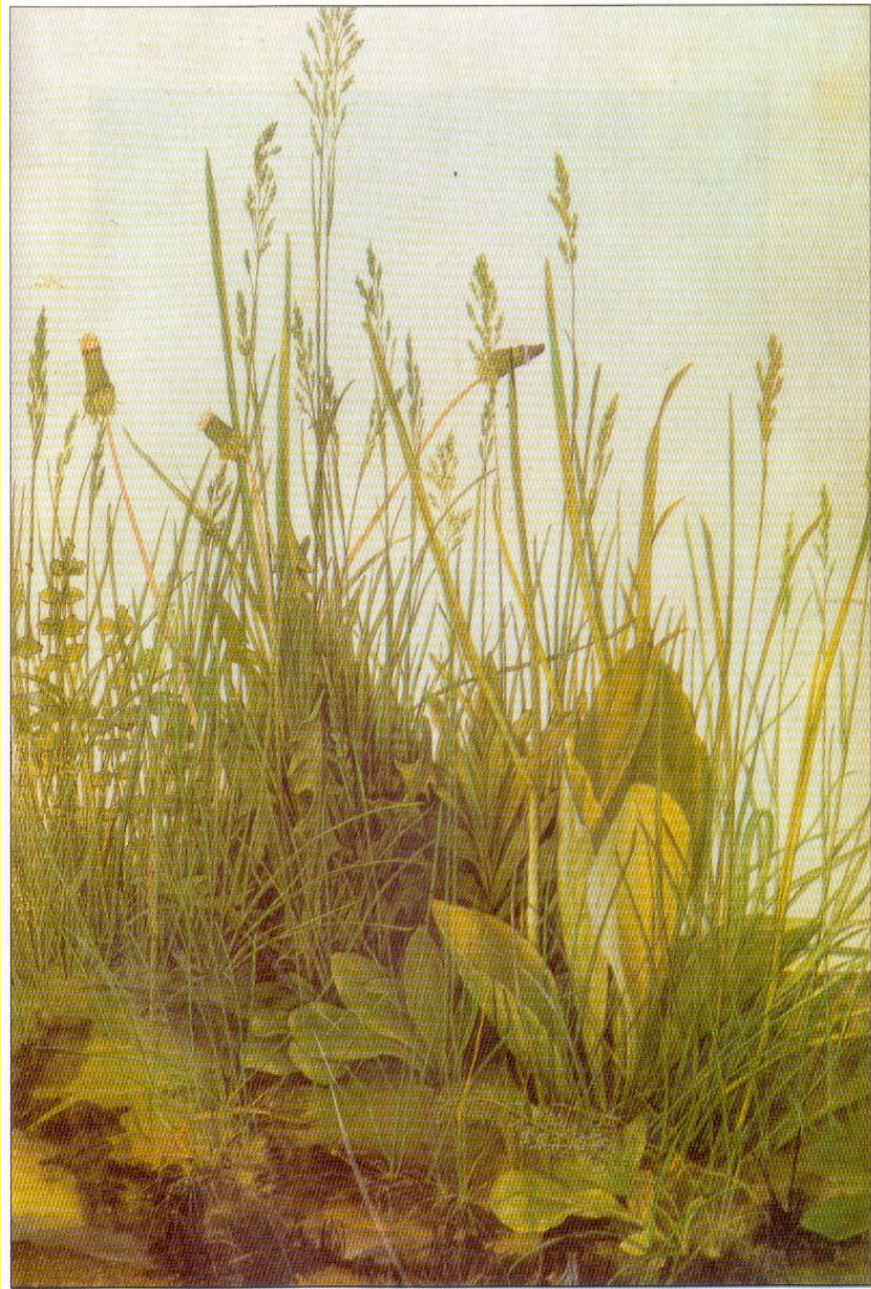
Альбрехт ДЮРЕР. Травы