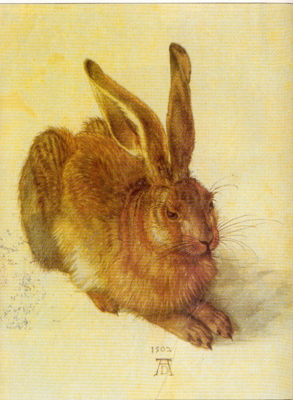
Альбрехт ДЮРЕР. Заяц