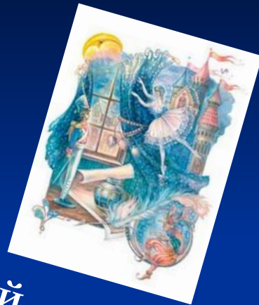
«Стойкий оловянный солдатик»