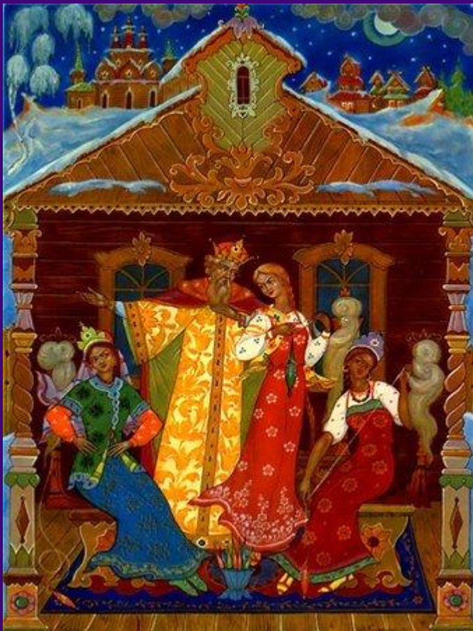
«Сказка о царе Салтане»