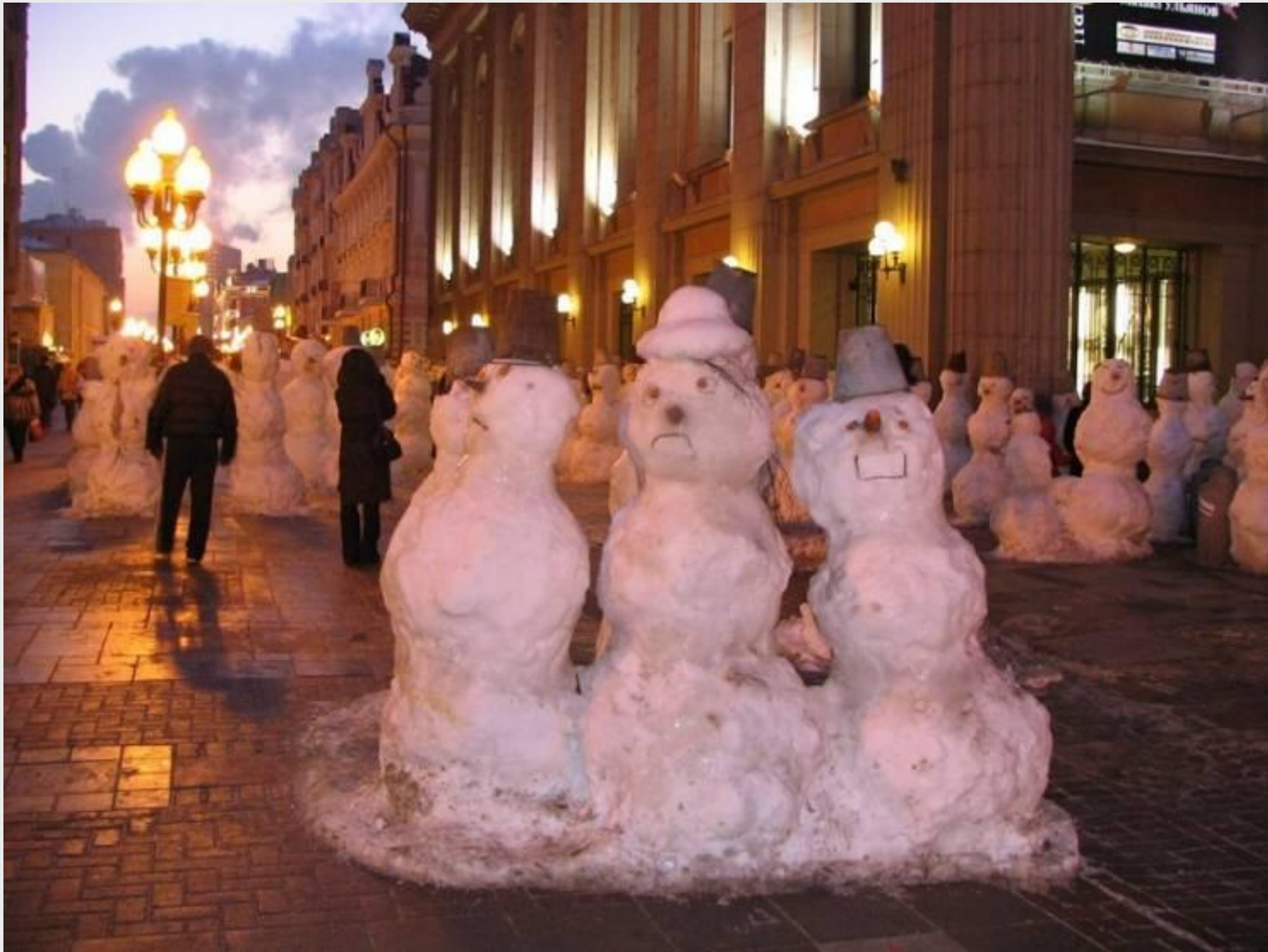
Снеговики на Арбате