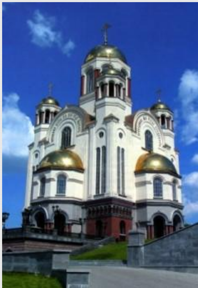
Храм На Крови