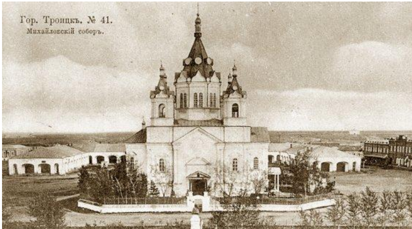
Гор. Троицк. № 41. Михайловский собор.

В 1879 г. открылась первая библиотека в Оренбургской губернии.