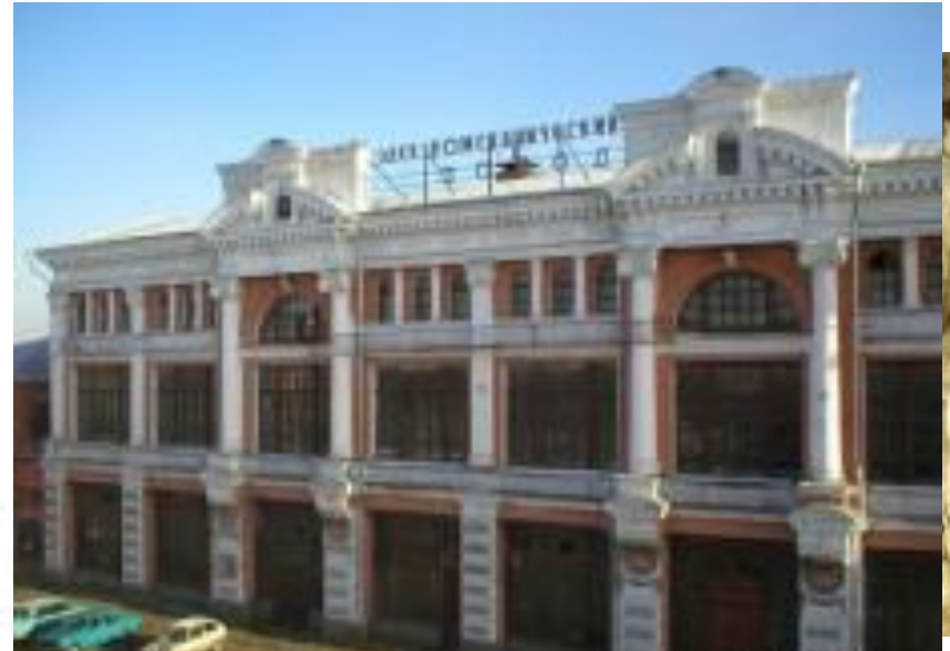
Пугачевская гора Электромеханический завод