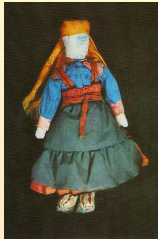
Рис. 10. Детская кукла.

Ненецкая кукла постепенно становится сувениром, который стараются приобрести гости Ямала.