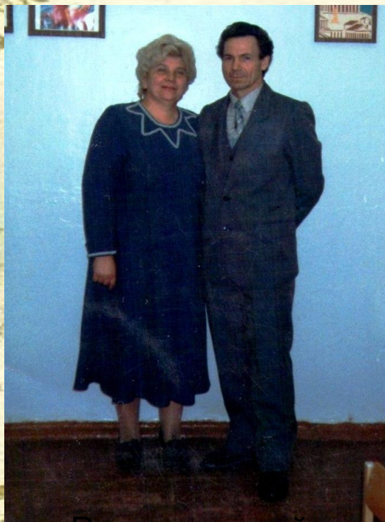
Родители моей мамы