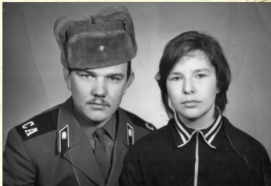
Родители моего папы