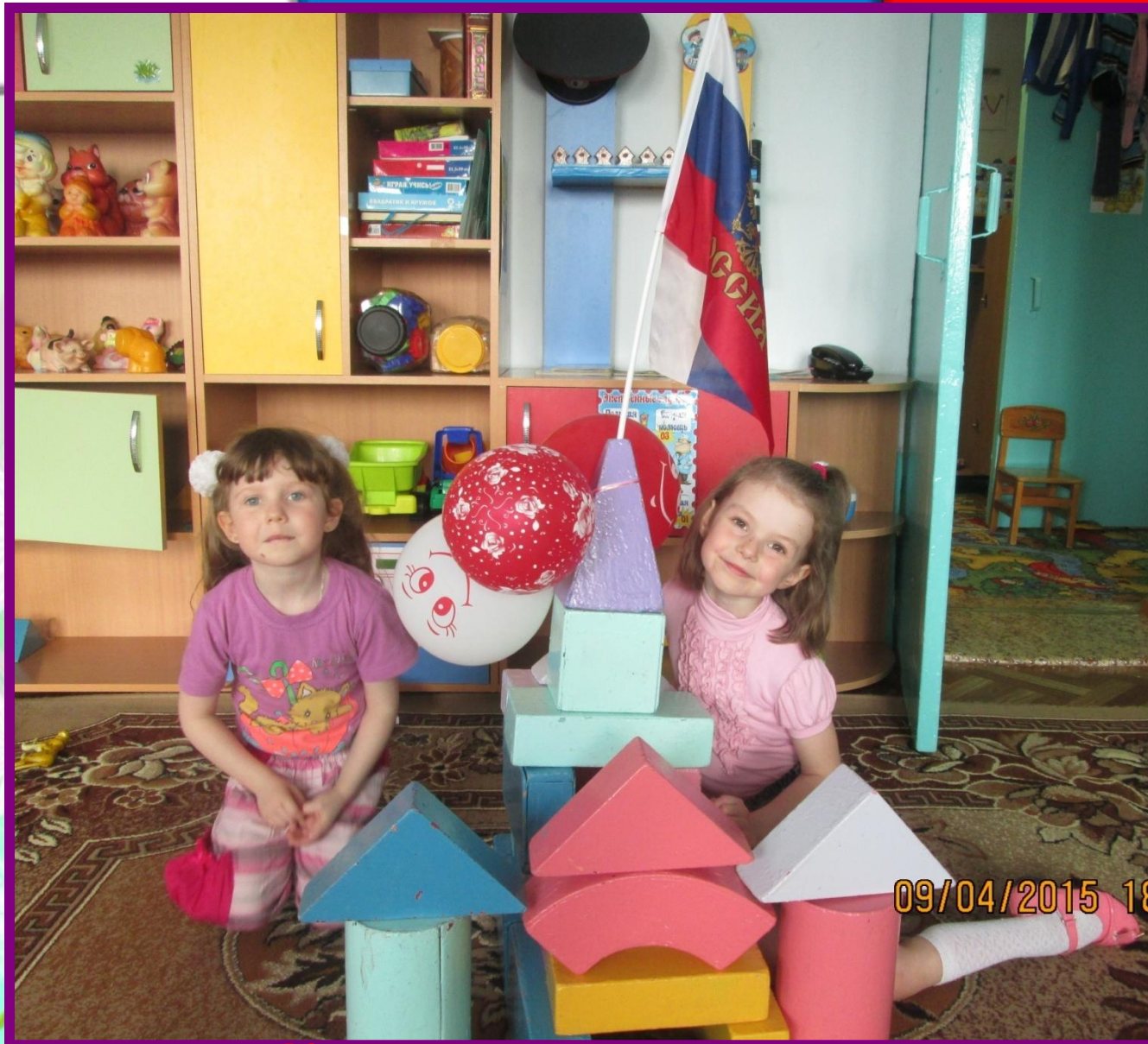
Конструирование «Праздничный дом»