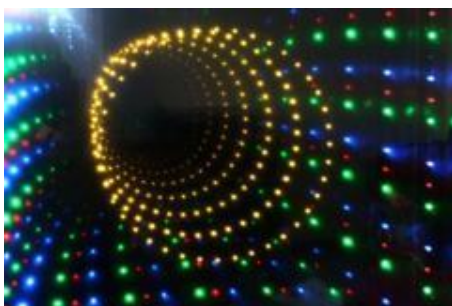
Световая панель «Туннель»