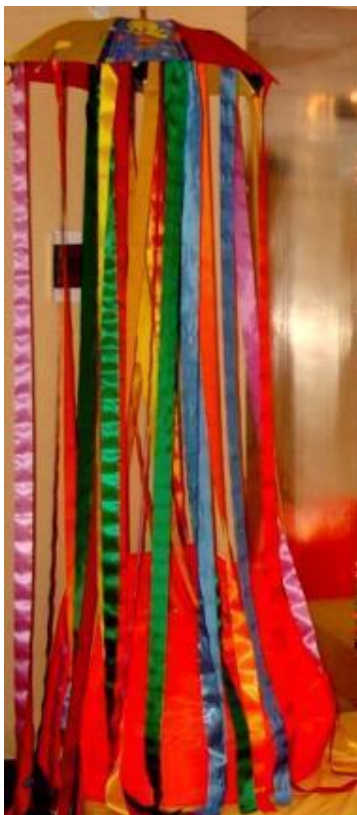
Сухой дождь (сухой душ)