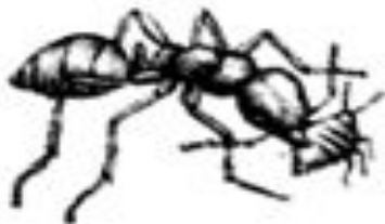
Желтый садовый муравей