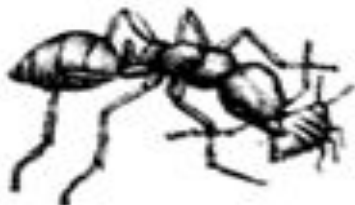
Желтый садовый муравей